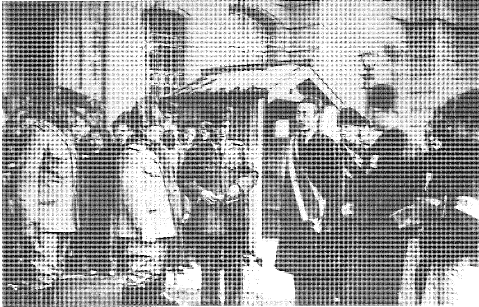
偽滿洲國成立後，日本也曾在東北推行縮小省區方案。

根據以上原則，報告書設計了甲、乙兩個劃分方案。甲案除蒙古、西藏外，將全國劃分為59省、3特別區；乙案除蒙古、西藏外，將全國劃分為64省 ⑦ 。