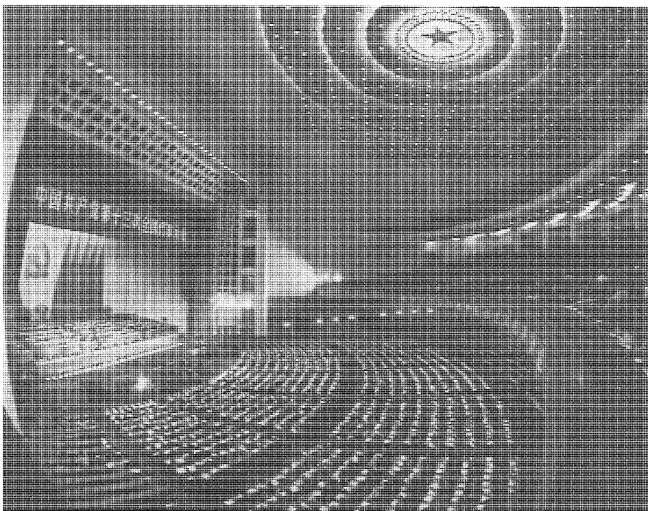
中共十三大以後，全國全面深化改革與建設。

伯克(Edmund Burke)在其《對法國大革命的反思》中說，「國家就是國家的稅收」(“The revenue of the State is the State”)。現在看來，在高度複雜的貨幣金融經濟中，這一兩百年前的觀察有待充實和補充。