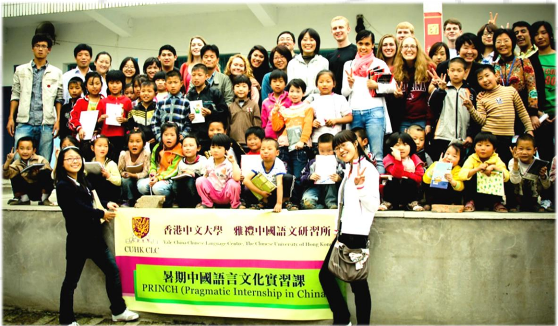
The Xi'an Hope School children and PRINCH students

大家好。昨天我们去看了两个地方，第一个是希望小学。我先给你们介绍一下这个小学。希望小学是1989年开始建的。国家和有钱的人建这样的小学是为了帮助穷孩子学习。昨天我们进学校的时候，小学生在学校门口唱中国歌欢迎我们。我一看到他们，就觉得他们确实很可爱。