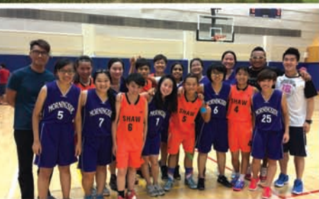
逸夫書院男子足球隊及女子籃球隊今年贏得「書院賽」冠軍。女子籃球隊更成功衛冕，成為「八連冠」的霸主。