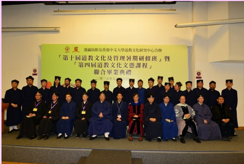
第十屆道教文化及管理暑期研修班畢業同學與主禮嘉賓合照留念

爲了積極推動道教學術和培訓道教界人才，於 2006 年 香港蓬瀛仙館與中文大學道教文化研究中心聯合舉辦「道教文化及管理暑期研修班」，2015 年 7 月 26 日(星期日) 校友會好榮幸獲邀出席「第十屆道教文化及管理暑期研修班」暨「第四屆道教文化文憑課程」聯合畢業典禮，典禮於中大利黃瑤壁樓舉行。筆者有幸跟隨校友會出席典禮，一同見證 20 位暑期研修班同學及 14 位文憑班同學之畢業盛事，真的是一次令人難忘的經驗。