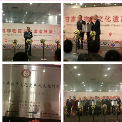
第四批國家級非遺代表性項目名錄進行頒牌匾儀式

主辦單位邀請民政事務局局长曾德成任主禮嘉賓，曾局長致辭時表示，「根與魂」展演系列是文化部與特區政府爲非物質文化遺產保護工作而合辦的重要項目。典禮上爲香港第四批國家級非遺代表性項目名錄進行頒牌儀式。第四批非遺項目涵蓋聯合國教育、科學與文化組織《保護非物質文化遺產公約》所界定的「表演藝術」、「社會實踐、儀式、節慶活動」和「傳統手工藝」等類別，具有突出的歷史和文化價值，並且在社區或相關範疇中具相當的代表性。