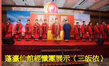
蓬瀛仙館經懺團展示〈三皈依〉