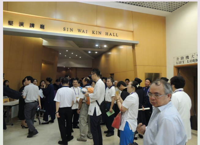
蒞臨觀禮之嘉賓人數眾多，場面熱鬧