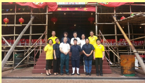
同學們與義工們合照

今年六月二十一日星期日（農曆五月初六日），中大道教文化課程校友會應儒釋道功德同修會之邀請，出席大埔元洲仔大王爺寶誕，當天下午舉行開壇祭禮，酬神儀式。當日，適逢父親節，由校友會主席帶領下，會晤儒釋道功德同修會會長黃維溢先生，及各執事、義工團員和香港道教青年團等代表。