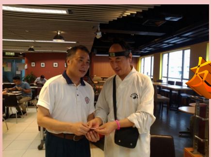
帶領內地學員到中大李慧珍樓咖啡店早餐