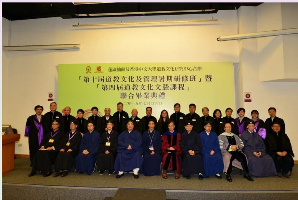
第四屆道教文化文憑課程同學與嘉賓、課程老師大合照