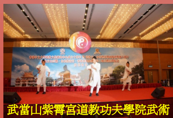
武當山紫霄宮道教功夫學院武術