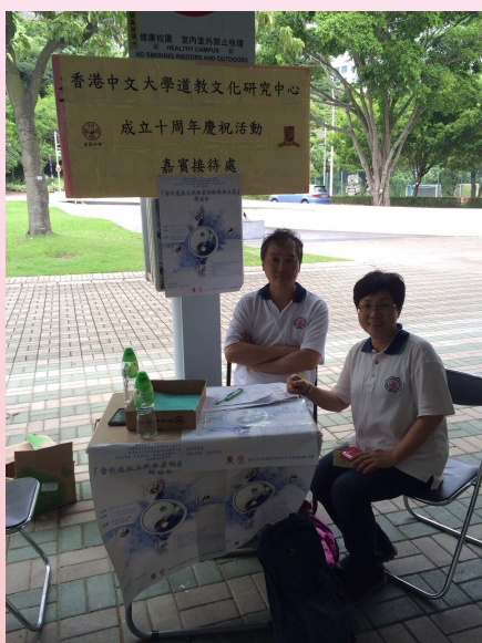
11:00am-18:00pm 火車站位置設街站