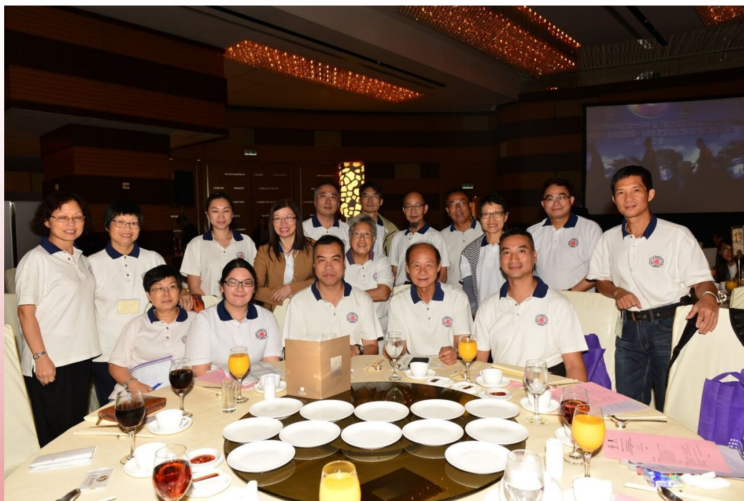
道教文化文憑課程歷屆同學難得聚首一堂，合照留念