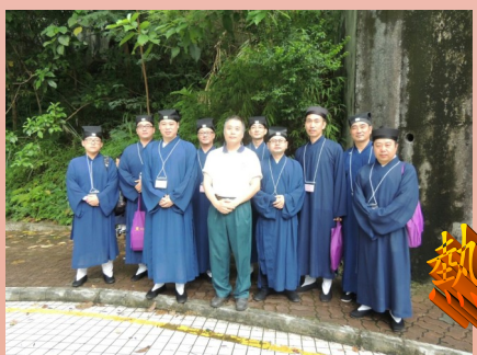
安排及指示內地學員在中大校巴士等候