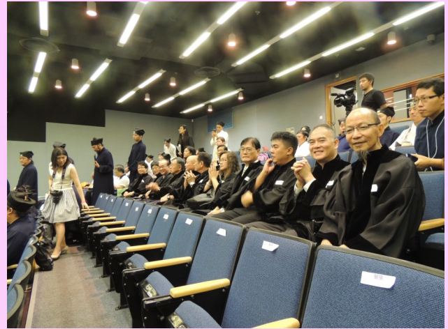
第四屆文憑班畢業同學

「十」是一個圓滿的數字，今年適值中文大學道教文化研究中心成立及研修班舉辦十周年，歷屆研修班同學藉此機會在中文大學再次聚一堂，實在非常值得紀念，直至2015年七月，暑期研修班已培訓了十屆同學，超過兩百名道門管理人才。此外，為了提升香港市民對道教文化的認識，協助文化工作者、教育工作者及道教神職人員回應社會大眾對道教知識的渴求，自2006年開始，香港中文大學道教文化研究中心聯同香港中文大學專業進修學院，舉辦道教文化證書課程，每年邀請不同的專家學者，講授道教文化的內涵。