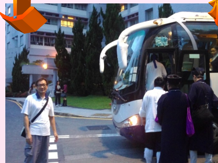
19:30pm 送學員上旅遊巴回宿舍