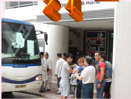
08:00am 到中大陳震夏宿舍接待學員