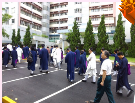
08:45am 帶領學員到利黃瑤壁樓演講廳