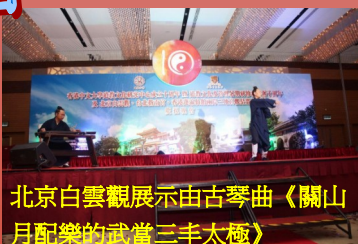
北京白雲觀展示由古琴曲《關山月》配樂的武當三丰太極