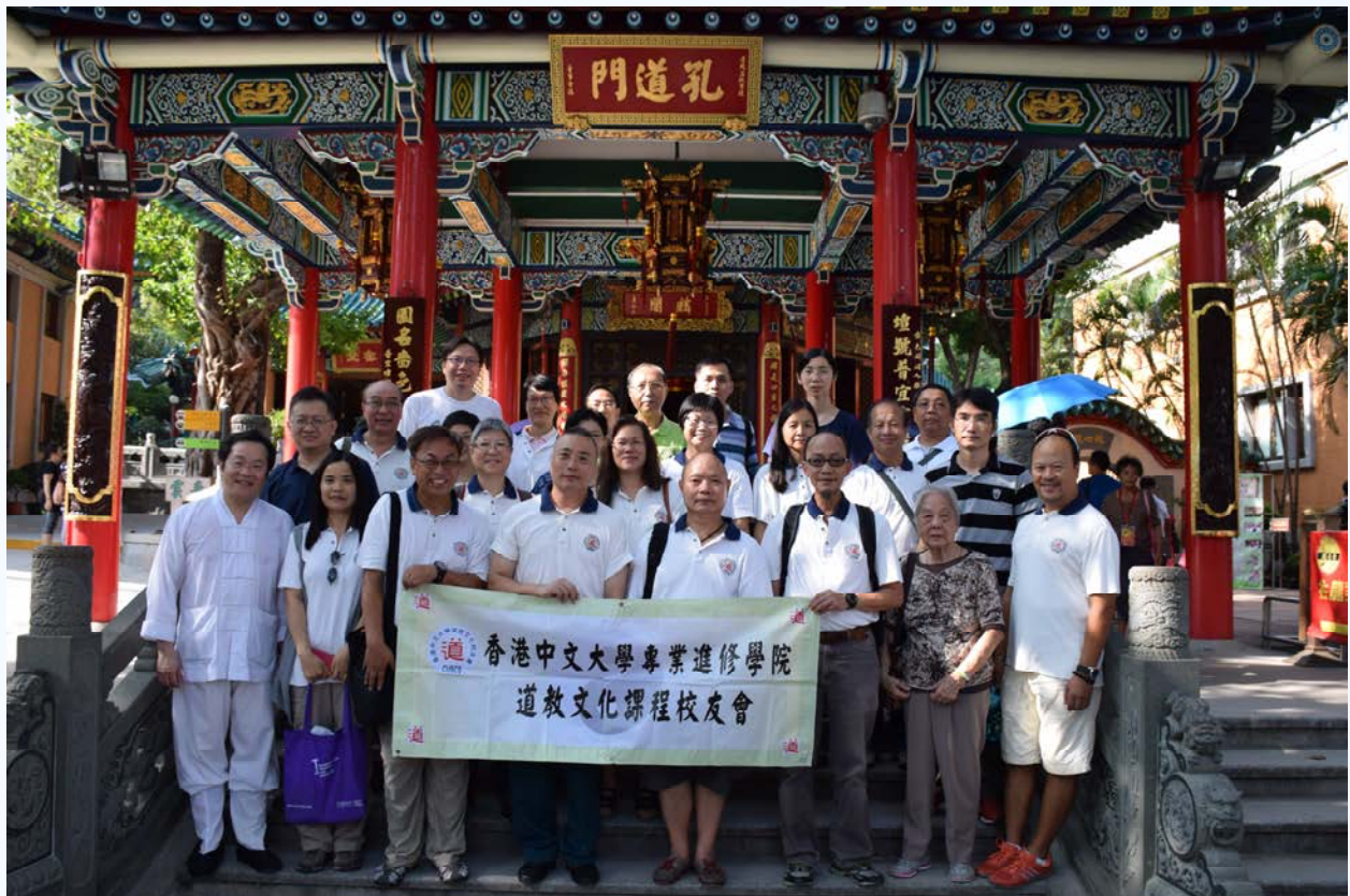
▲參觀後，同學在孔道門大合照！

最後，必須感謝邵光懷師兄為我們詳細介紹饒宗頤教授的作品，使我們獲益不少。例如《三教圖》饒教授運用白描手法，饒教授也特別注意紙張顏色的選用；又如印章蓋在作品不同地方，便有不同名稱。