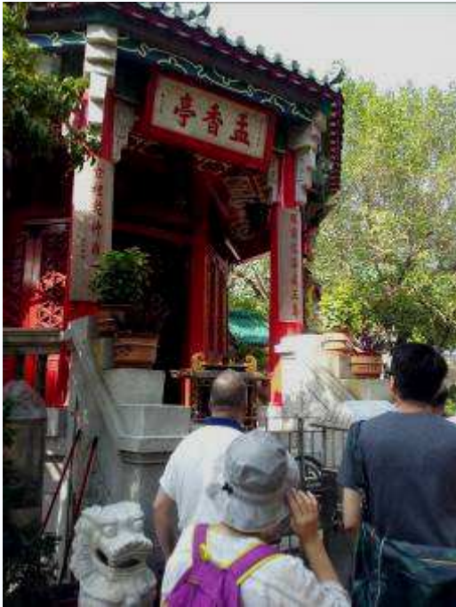
▲孟香亭為供奉燃燈佛