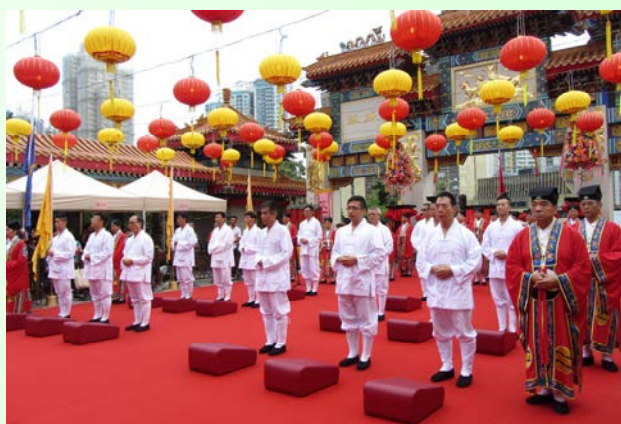
▲十多位戒子肅立在大殿前