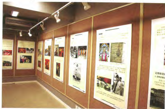
◎ 「道堂科儀與香港社會人生圖片展」展出道堂科儀與香港社會發展及生活習俗之關係