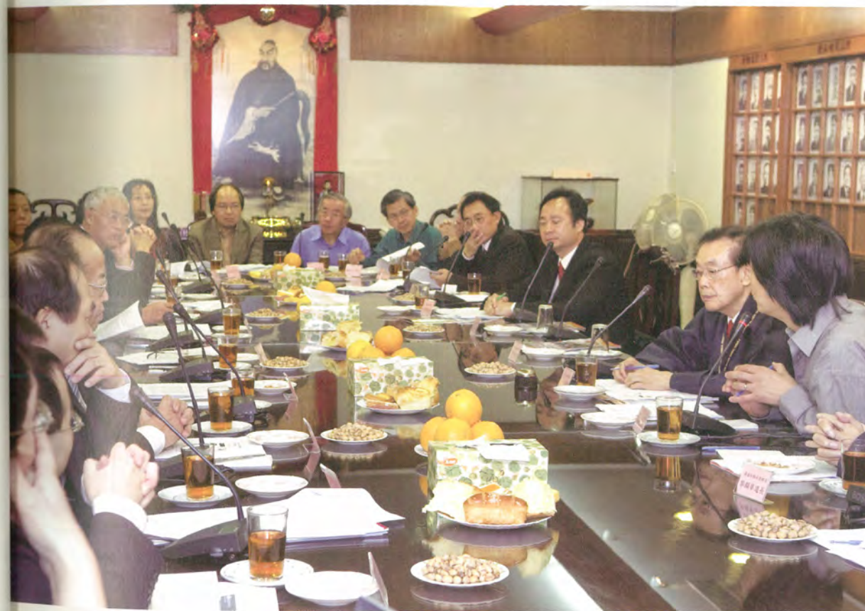
◎ 道教文化資料庫周年大會