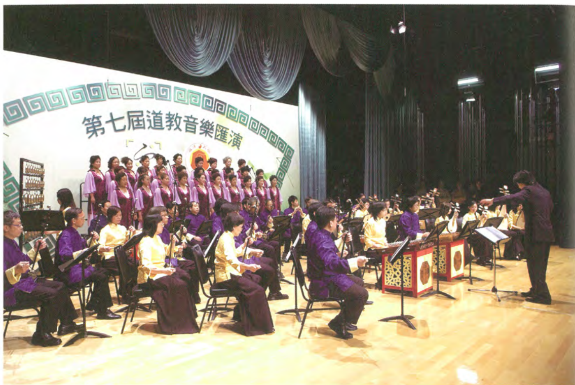
◎ 香港道樂團於「第七屆道教音樂匯演」中演出

是經香港政府註冊的唯一專事道教音樂編撰和演出的團體，以廣大民眾喜聞樂見的藝術形式，作舞臺觀賞演出。2001年起，道教界每年在不同的地區舉辦一次「道教音樂匯演」，香港道樂團都積極發動、參與及協助組織此項道教盛事。