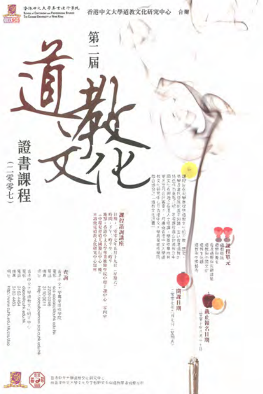
◎第二屆道教文化證書課程