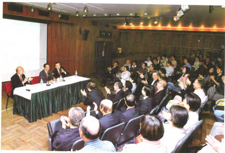
◎ 蓬瀛仙館於香港大會堂舉辦的「名人講座」