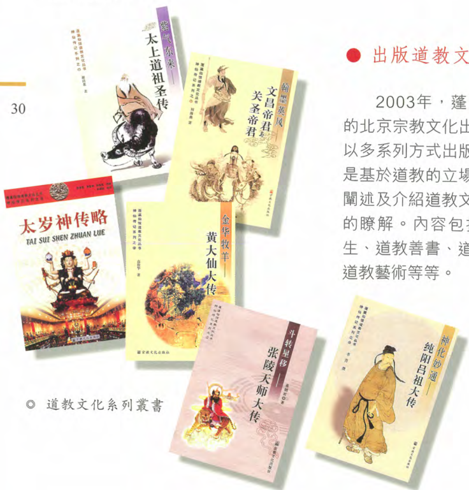
◎ 道教文化系列叢書

2003年，蓬瀛仙館與國家宗教局的北京宗教文化出版社達成合作協議，以多系列方式出版道教文化叢書。目的是基於道教的立場，有系統及有層次地闡述及介紹道教文化，加深人們對道教的瞭解。內容包括道教神仙、道教養生、道教善書、道教科儀、道教建築、道教藝術等等。