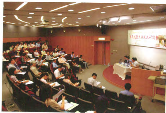
◎ 先天道歷史與現況研討會