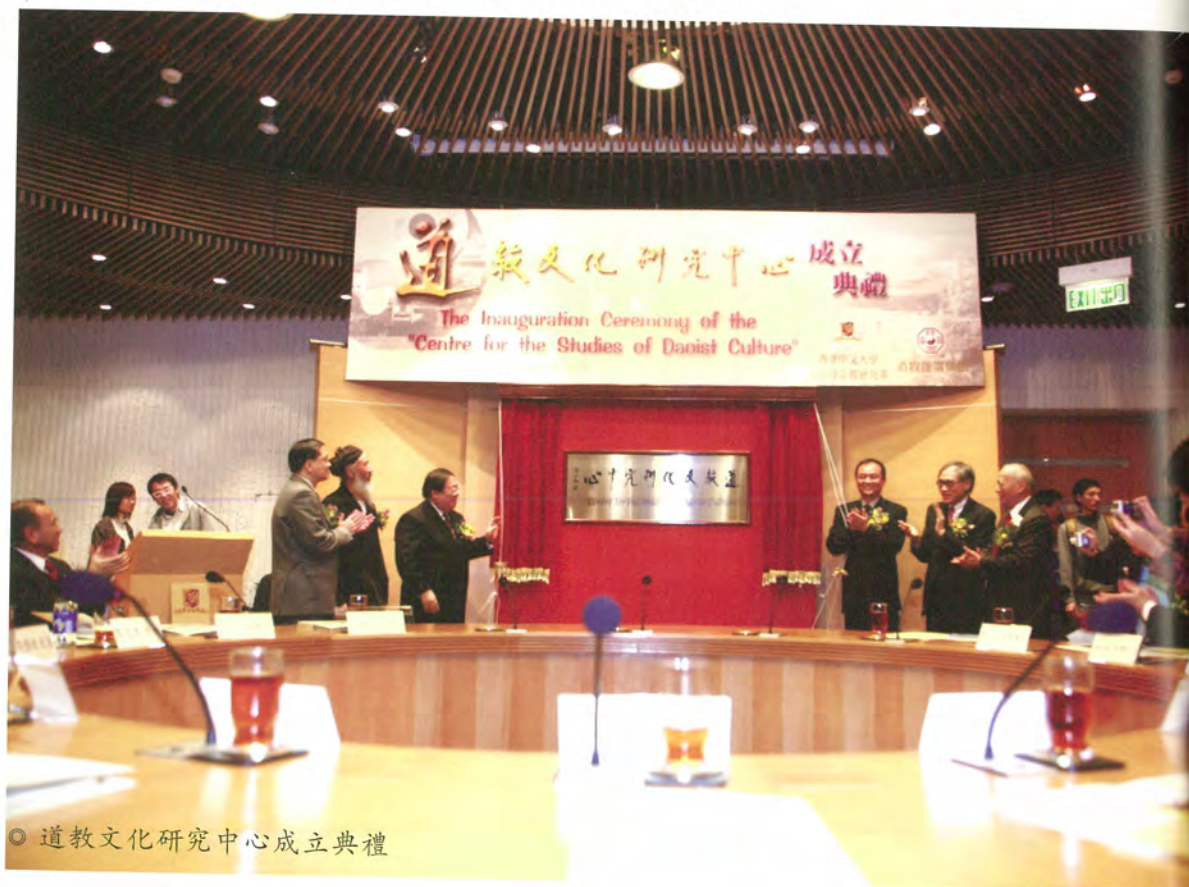
◎ 道教文化研究中心成立典禮