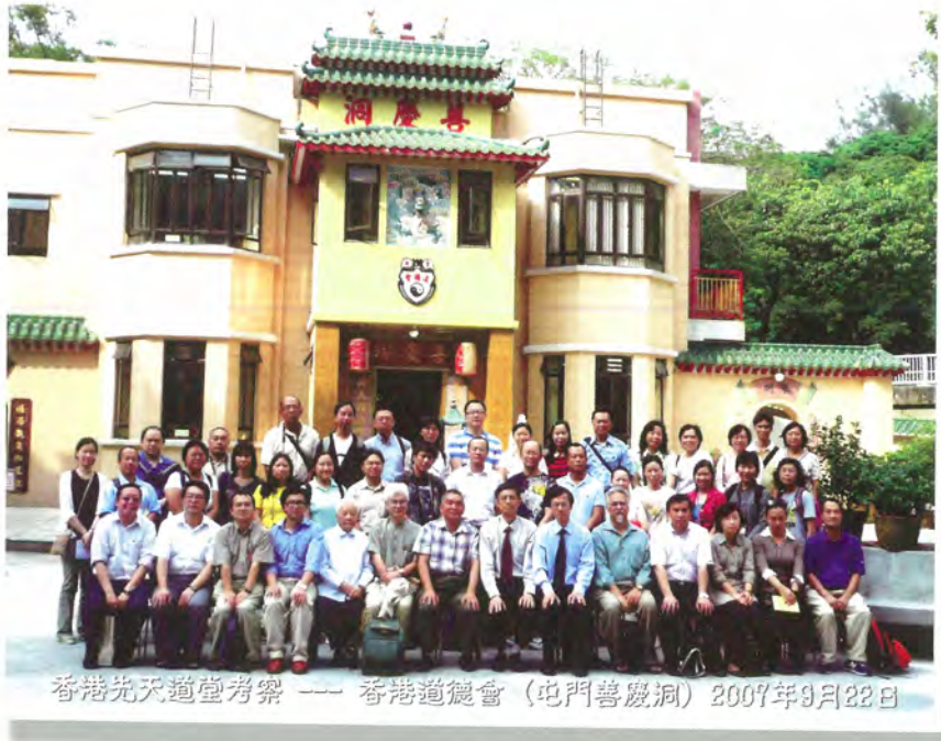
香港先天道堂考察 —— 香港道總會 (屯門善慶洞) 2007年9月22日

地址：香港沙田香港中文大學 許讓成樓405室 電話：(852) 3163 4464 傳真：(852) 3163 4463 電郵：daoist@cuhk.edu.hk 網址：www.cuhk.edu.hk/crs/dao