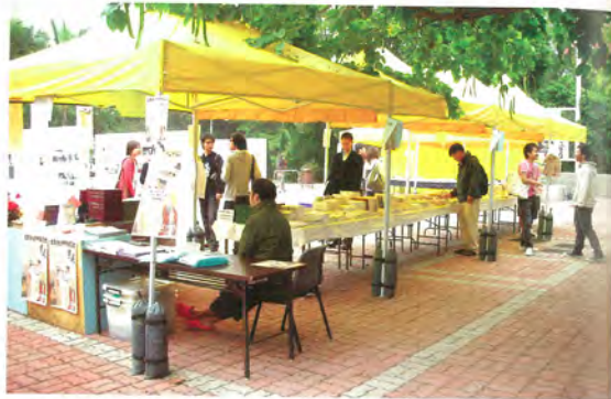
◎ 於香港中文大學舉行的「道教文化與中國宗教書展」