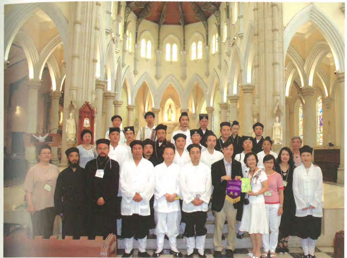
◎首屆暑期研修班道士學員到天主教聖母無原罪主教座堂考察