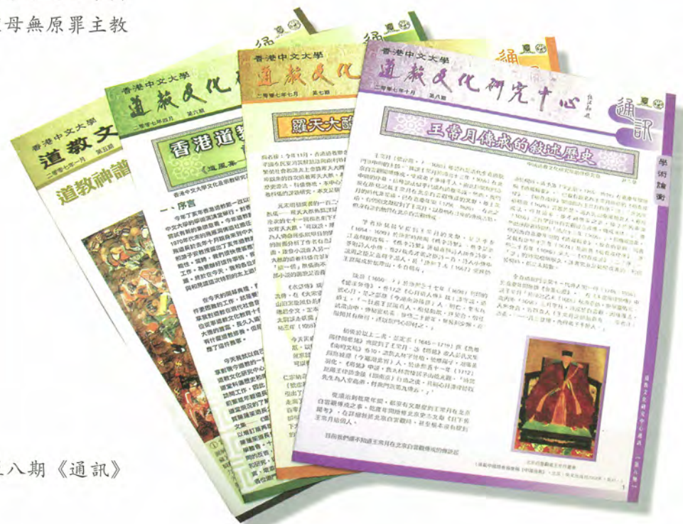
◎中心第五至八期《通訊》