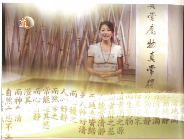
◎ 《道通天地》電視頻道節目

2003年，蓬瀛仙館與香港寬頻網絡有限公司合作，在香港寬頻有線電視718台推出。一條專門、24小時播放，以生動、活潑方式，及生活化地介紹道教文化的電視頻道，這是有史以來的創舉。《道通天地》部份節目同時於道教文化資料庫的電視網站( http://www.taoist.tv )播放，配合互聯網這種無遠弗屆的優勢，讓人們領略道教文化的智慧。