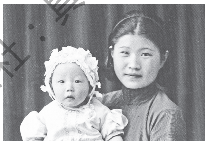
1936，大哥週歲，母親將他裝扮成女孩。