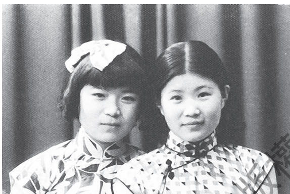
1935，母親和她的妹妹「四摩登」。

《天鵝》歌劇是她最盛大的參與，雖然扮的只是八個王子之一，沒有獨唱的份，但她可以從頭至尾把整個歌劇吟唱下來。這也成了我小時候學會的第一組歌：「我們還有一個妹妹，她比我們都聰明。她有小凳，金子做成；她有圖畫，值千金，妹妹，妹妹，快來快來，大家一齊同歡欣」，「謝謝哥哥們，不要太高興，莫要忘記了，後母心毒狠，她要打我們，還要罵我們，常想把我們，一齊趕出門。」我的小名叫「妹妹」，媽媽心中對歌劇中妹妹和天鵝哥哥們遭後母逼害的感受是如此真切。數十年後，她被疾病殘酷折磨，醫生宣佈她最多只有三年生命，但是母親一年又一年頑強地忍受，支持她苟活的信念是不能讓她的四個子女受後母之苦，不可讓「妹妹」被欺負。