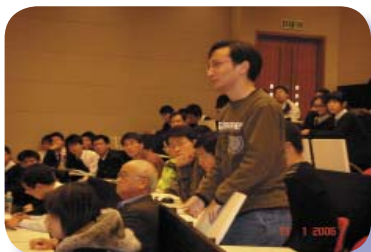
同學發問宇航問題