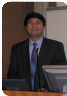
主講嘉賓—蔡國瓚教授

北京航空航天大學於2006年1月13日派出代表團前來香港訪問香港中文大學，向教師及學生們講解宇航知識，並於當日下午3時30分於邵逸夫夫人樓LT1室舉行「航天科學技術發展現狀與趨勢」講座，由北京航空航天大學宇航學院常務副院長蔡國瓚教授主講及理學院署理院長關海山教授主持。講座吸引過百名中大師生和中學生參加。當日花絮如下：