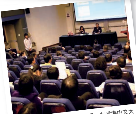
學術研討會已於2009年2月13日，在香港中文大學圓滿舉行