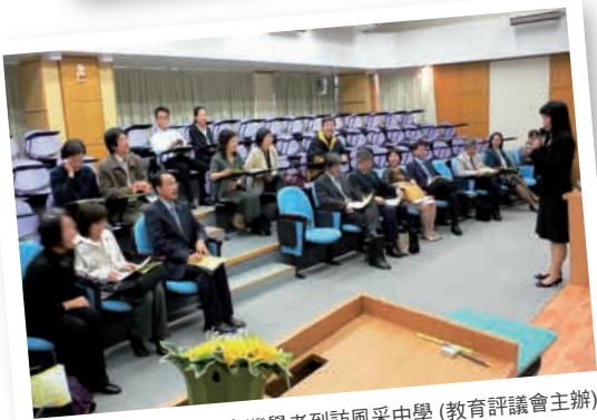
學校發展及評估組與台灣學者到訪風采中學(教育評議會主辦)

在2009年2月12日研討會的上半場，國立台灣師範大學教育學系陳佩英教授及國立清華大學通識教育中心謝小芩教授，以「台灣高中優質化之革新政策」作專題主講，及後四位台灣知名大學教授亦分別就台灣教育制度引伸的問題和新思維作演講，最後由三位台灣高中的校長分享學校優質化的歷程和成果，作為上半場的總結。