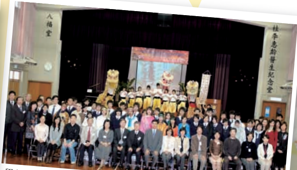
學校發展及評估組及台灣學者與中華基督教會桂華山中學校長及師生交流後拍照留念