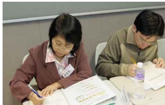
▼ 學校同工認真地討論工作紙上的課題

基於相信每個學生都是獨一無二和具有學習能力的教育信念，課程發展議會(2001)亦建議所有學校自行檢視現有的評估方式，以加強促進學習的評估。