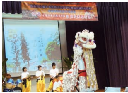
中華基督教會桂華山中學的學生於交流活動中表演舞獅

在2009年2月12日研討會的上半場，國立台灣師範大學教育學系陳佩英教授及國立清華大學通識教育中心謝小芩教授，以「台灣高中優質化之革新政策」作專題主講，及後四位台灣知名大學教授亦分別就台灣教育制度引伸的問題和新思維作演講，最後由三位台灣高中的校長分享學校優質化的歷程和成果，作為上半場的總結。