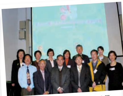
彭新強教授與到訪的台灣學者及校長合照