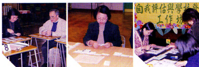
校長及老師齊作反思，改進教學