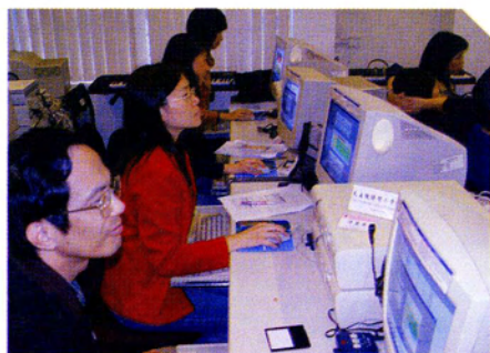
學習運用電腦數據分析軟件

參考文獻 Scottish Office. (2002). How good is our school? (2002 Ed.). Edinburgh: HM Inspectorate of Education. Scottish Office of Education Department. 教育署(2002)。《學校教育質素保證：香港學校表現指標(中學、小學及特殊學校適用)》。香港：教育署。 教育署(2002)。《質素保證視學周年報告2000/2001》。香港：教育署。 彭新強(2000)。〈表現指標與質素保證〉。《教育學報》，第二十八卷第二期，頁137-155。