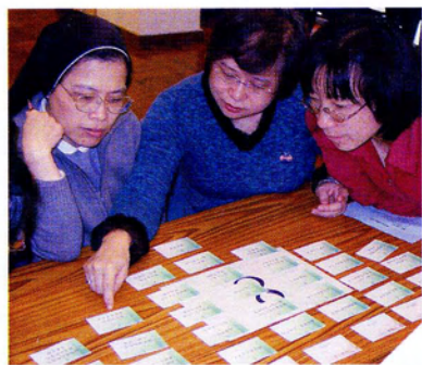
老師從遊戲中理解學校管理取向

由於我是自我評估委員會成員之一，亦有份參與兩期的培訓課程，而且在學校的評估工作上，由問卷構思、工作坊討論及分析、到撰寫評估報告等，一直有機會親身參與，因此對評估的理念很清晰，亦能掌握當中技巧。