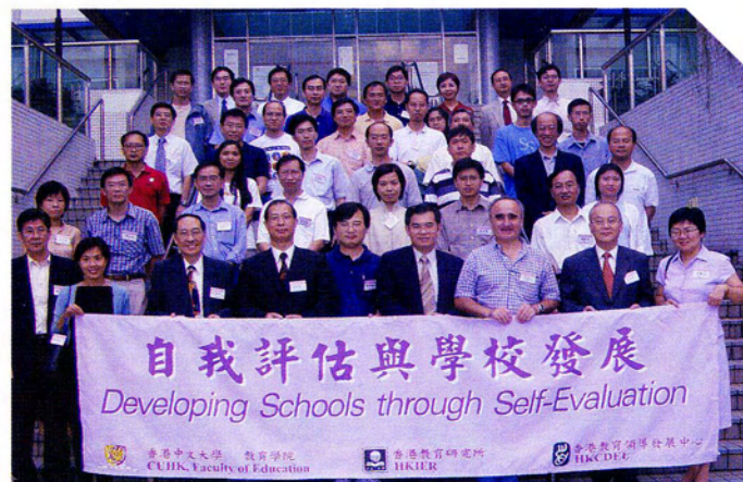
參與今期的中小學校長及學校自我評估委員會成員與計劃小組導師合照