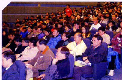
教育同工踴躍參加