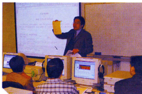
講解如何分析數據