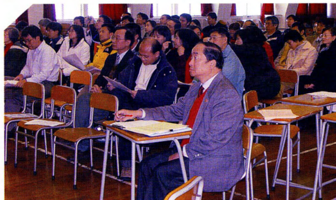
校長與同工在學校工作坊細心聆聽

香港教育前線老師絕大部份是優秀的和有承擔的，期望愈來愈多學校能推行校內評估，制定校本表現指標，將香港教育辦得更好。