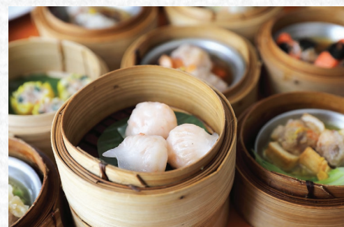
圖片（左一、二）來源：香港旅遊發展局