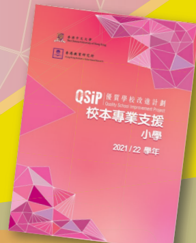
QSIP「校本專業支援」 舉隅小冊子 (小學)