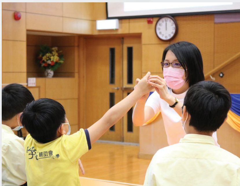
■ 秀怡說，跟傳統課堂不同，全方位學習可為學生帶來親身體驗，如教師帶領學生進行社區探究、學習粵劇表演等，可令學生從經歷中有所反思。

陪伴教師同行多年，她指出全方位學習可讓學生發揮個人潛質，令教師對他們的表現改觀。「全方位學習活動能補足課堂學習，讓不同能力、性向及學習風格的學生有展示機會。例如有些學生平日不習慣在課堂上『坐定定』聽講，但當他們參加粵劇主題活動時，能在表演或演奏樂器方面表現突出，因而令教師認知到學生有不同的潛質，發現每個學生都有不同的可能性；即使平日在課堂內表現較遜的學生也有其他的潛質，因而帶動教師在思維上的轉變，那是我最感動的時刻！」多年來收集到很多歡笑快樂的片段，也是她的滿足感之一。