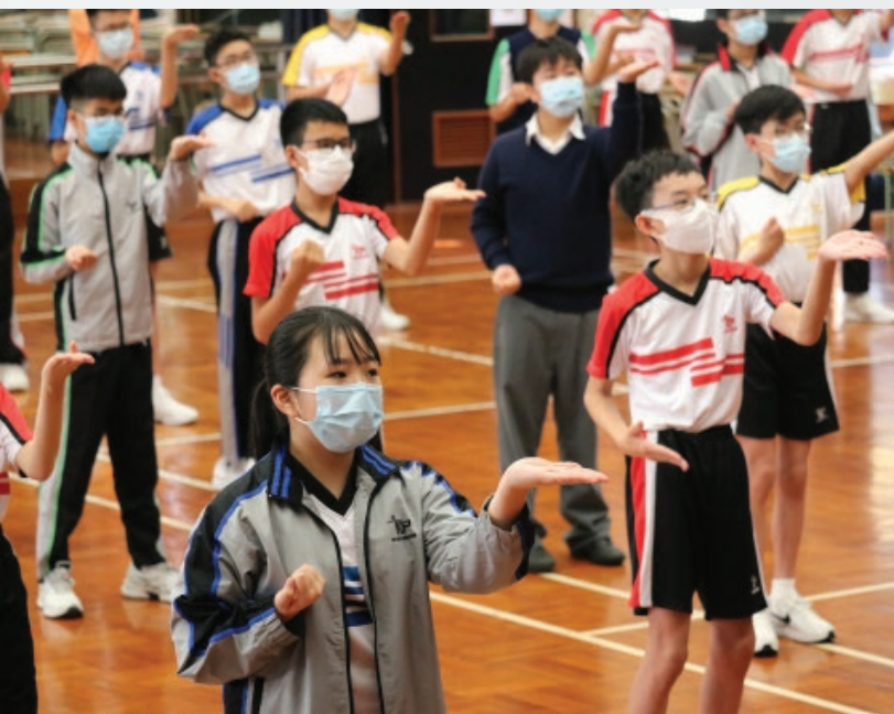
■ 主題週可為學生帶來知識、技能及態度上的提升。