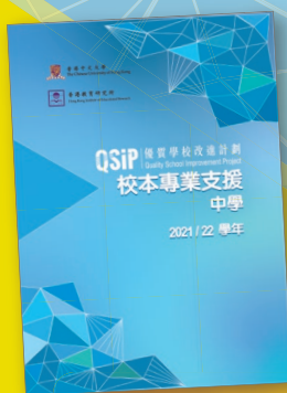
QSIP「校本專業支援」 舉隅小冊子 (中學)