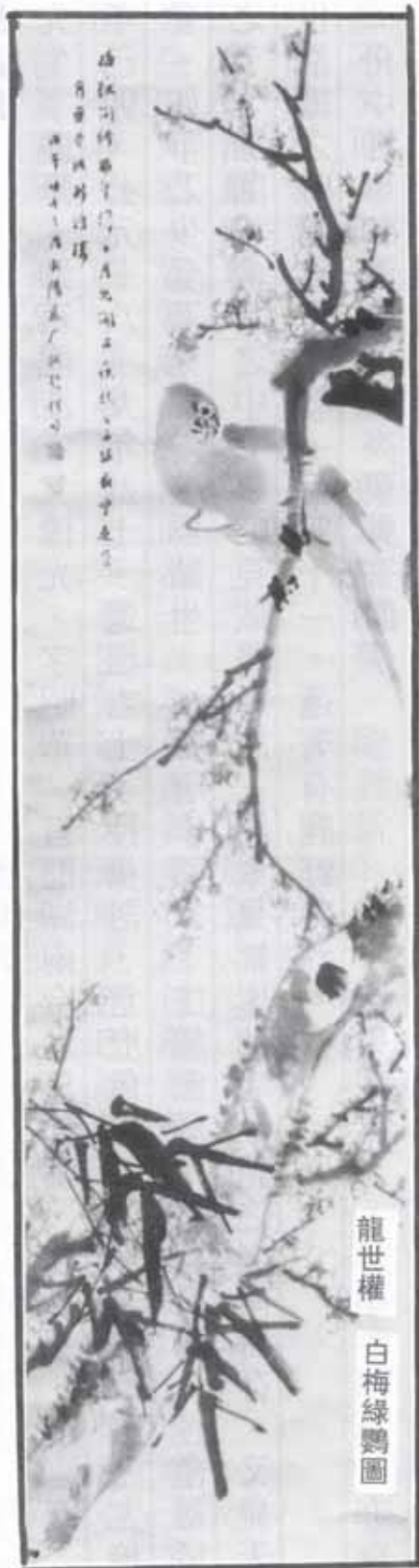
龍世權 白梅綠鸚圖