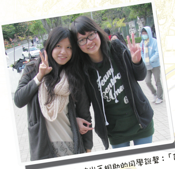
*兩位陳同學想在此向各位出手相助的同學說聲：「謝謝你！」

「我們一起『上莊』，要『set counter』宣傳那天只有我們兩個女生，而且發現還沒有預訂任何桌椅用品，心中十分焦急無助。後來遇到一名同樣來自『政政』系的同學，雖然大家只在上課時見過幾次面，並不相熟，但他卻呼朋引伴找來其他同學幫忙，各人紛紛『出謀獻計』；旁邊國是學會的同學亦答應將他們用完的桌椅借給我們。到收拾攤位時，雖然已經很晚，但正在趕校巴回家的同學看到我們東西太多，也主動來幫忙，真的令人十分感動！」