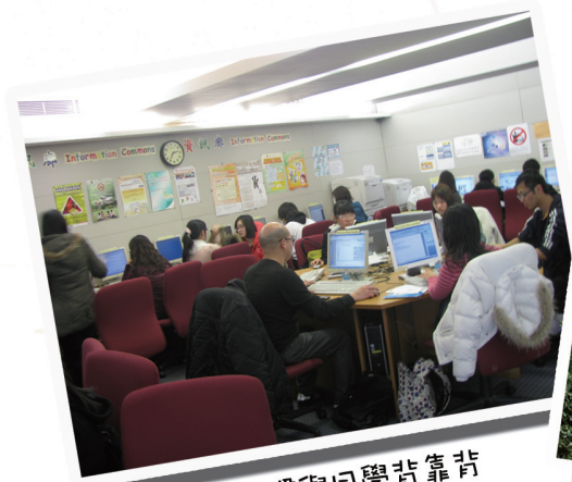
*我們總是習慣與同學背靠背各自工作，但其實「背靠背」亦是難得的緣份。