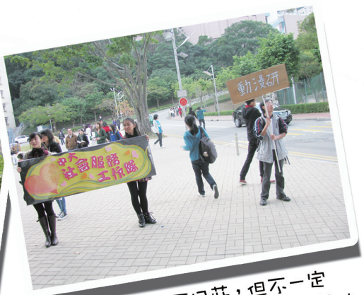
*大家雖然不同莊，但不一定是競爭對手，還可以是互相幫忙的親密戰友。

有人說大學生活是「三年一夢」，希望各位同學都可以有一個令你一生回味、充滿喜悅的美夢。在此，亦鼓勵大家向關心你或曾豐富你生命的人表達感謝和讚美。