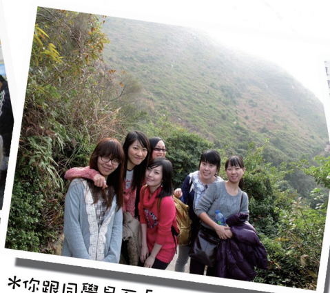
*你跟同學是否「hi-by friend」？一起行山亦是增進感情的好方法！