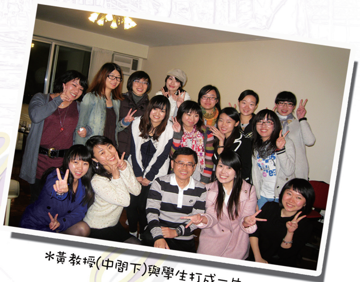
*黃教授(中間下)與學生打成一片。

其實不單只我，中大的老師都十分有心，希望同學除了學業上的疑難之外，亦可以和我們分享工作上、求職上、生活上的煩惱，請同學不要害羞，找我們一起玩樂。」