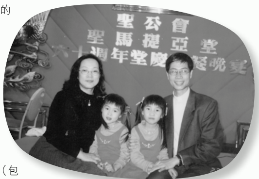
香港聖公會聖馬提亞堂堂慶