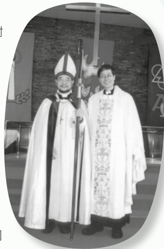
與香港聖公會西九龍教區 首任主教蘇以葆主教合照於 香港聖公會聖馬提亞堂

我十分敬佩榮休院長盧龍光博士，和兩位榮休的神學組主任——陳佐才博士及周天和博士：盧龍光牧師豪氣干雲，敢作敢為，克服各種挑戰，擴建崇基神學院，帶領神學院進入嶄新的發展階段；陳佐才法政牧師的講課非常精彩，文章和著作寫得出色，他所提出的「武俠靈修」創前人之所未見；周天和牧師是《新約聖經》和翻譯方面的專家，是位謙謙君子，待人溫文有禮，親身示範何謂終生學習，是學生和後輩的良好典範。