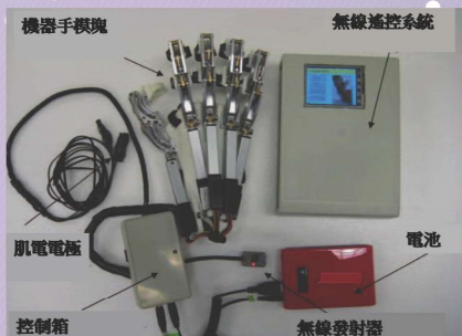
機械手訓練系統的組成部分

香港賽馬會慈善信託基金與香港中文大學合作，共同開展為期三年的中大賽馬會凝聚希望計劃，將在40間長者護理中心及復康中心引入四項創新復康技術，讓更多市民受惠。