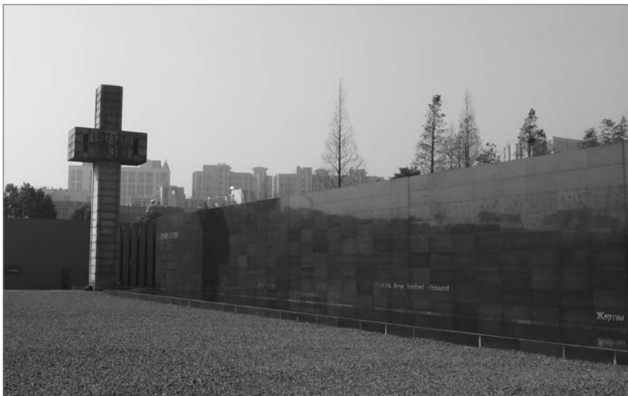
南京大屠殺紀念館

若林正指出南京大屠殺一直都是中國、日本和西方史學界的爭論焦點。在大屠殺的死亡數字上，中國政府在1983年宣稱超過三十萬，但有日本右翼學者則認為這個死亡數字是中國人用來誹謗和抹黑日本人民的。