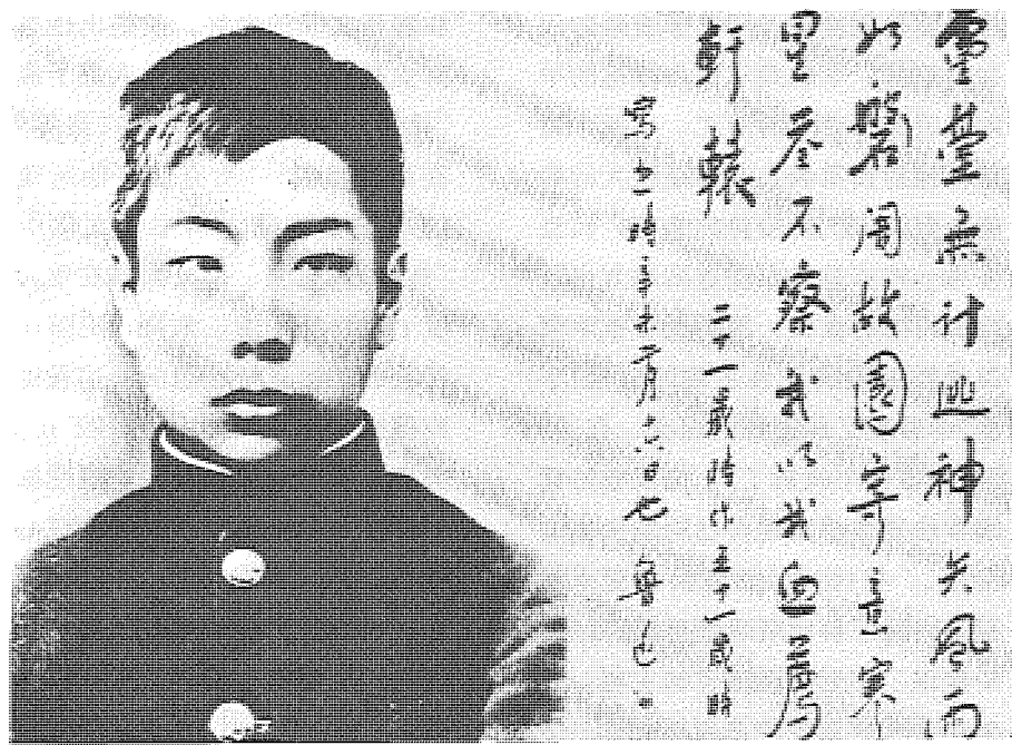
圖 李歐梵在通常被解釋為愛國主義或民族主義的魯迅的《自題小像》中發現了孤獨者的現象。

魯迅面臨着比他的同時代人遠為複雜、矛盾的問題。僅僅認為他與某個運動完全一致, 把他指派為一個角色或使他從屬於一個方面, 都是誇大歷史上的抽象觀念而犧牲了個人的天才。