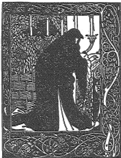
圖（左）比亞茲萊 《阿賽王故事》插畫， （右）古潑略諾夫 《熨衣的婦女》