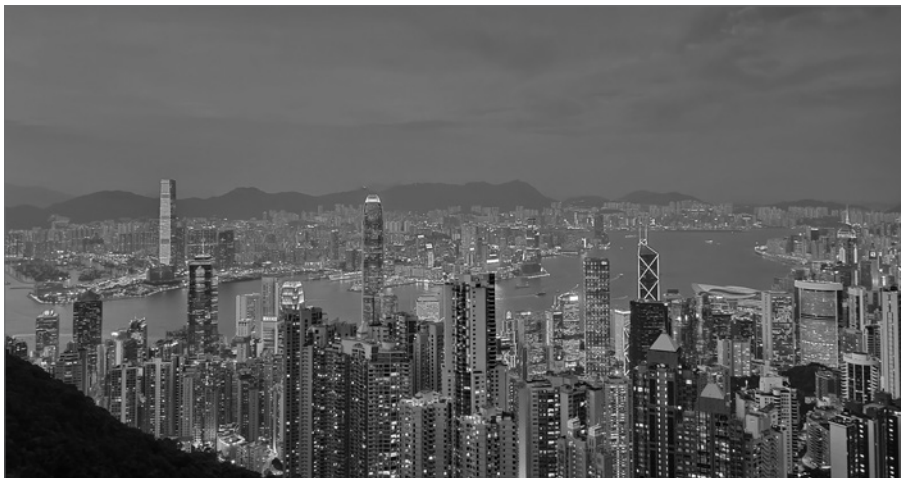
香港跟中國民主路的關係密切。（資料圖片）

如果民主的最終結果是中共有可能失去領導權，恐怕未必能說服如今的中共接受作者這個民主的計劃。中共有壓倒性的實力，但它是否有足夠動機去接受可能引致天翻地覆的「民主的預備」？