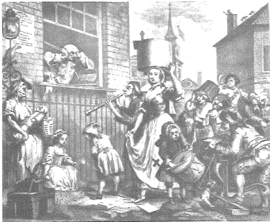
英國民俗中流行的「聚眾起哄」雖被視為惡作劇，但卻體現了轉型社會中的民間力量。

是在談論「風俗」，毋寧說是在談論「傳統」，以及與傳統相關的道德準則，乃至社會形態。這一類文章論戰性特別強，每一篇都可以說是一個完整的體系，因此全書就很難有一個共同的中心，每一個章節之間也就很難產生必然的聯繫了。