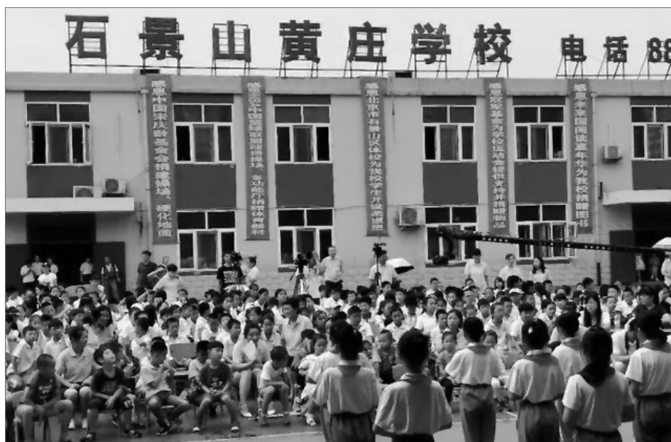
黃莊學校曾經是全北京最大的打工子弟學校。(資料圖片)

2014年後，在北京城市快速升級、嚴格控制人口規模的背景下，愈來愈多打工子弟學校被關停。例如位於北京石景山區的黃莊學校是全北京最大的打工子弟學校，擁有超過1,800名從小學到中學不同年齡段的學生，教職工120名，建校二十年來解決了數以萬計流動兒童的就學問題。2018年8月，這所學校剛剛在暑假舉辦完二十周年校慶，就在臨開學之際，被地方教委的一份通告指出「辦學許可證到期，校址不再具備繼續辦學條件」，被迫封校。在校學生因為絕大多數都沒有北京戶籍，或者被分流至安置學校（校舍、校園的條件較之前相差太遠）；或者告別北京回到他們的家鄉，成為留守兒童。目前，北京石景山區僅存一所打工子弟學校 ④ 。