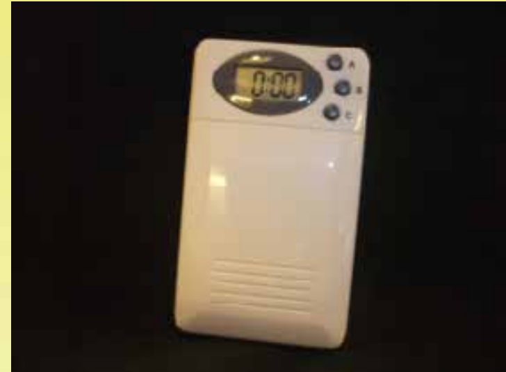
電子響鬧提示藥盒