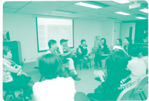
活動順利完成後，核心小組組員互相鼓勵，並進行活動檢討。