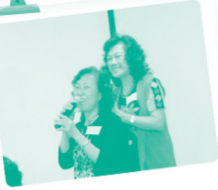
義工們載歌載舞，台上台下都樂在其中。