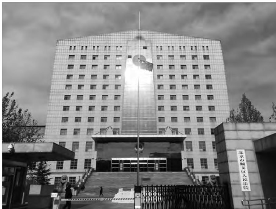
在全能型政府體制之下，中國律師業的處境與國家息息相關。

本書的兩個關鍵詞是「競爭」與「交換」。「競爭」包括國家層面主管機關之間的競爭；不同法律服務群體在法律服務市場上的競爭。法律服務群體能夠推動本行業管制部門為其利益而鬥爭，是因為兩者之間存在一種交換關係。