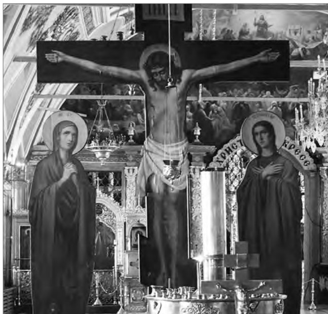
上帝是否存在是歷來爭論不休的話題。(資料圖片)

利了，可以說滿清贏了才是真理。可是在文化層面上，文字滅亡了、滿文化也被消滅了，清朝贏了嗎？金庸生前多次和我談歌詞，他最喜歡的歌詞是「滄海一聲笑，滔滔兩岸潮……誰負誰勝出天知曉？！」從不同層面看勝負，確實可作出不同判斷。在北京時，曾認定「一分為二」是真理，出國後學佛學禪，又認定「不二法門」是真理。那麼，到底哪個命題是真理呢？其實，不同層面上，二者都可成立。真理發展到偉大哲學家康德(Immanuel Kant)那裏，「一」變成「二」。真理化為悖論，化為二律背反。矛盾，悖論，二律背反，其實是一個意思，都是指相反的命題均符合充分理由律，即相反的命題都帶有真理性。這樣，真理就不是一，而是