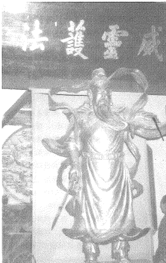
圖3 (左)廣西桂平洗石庵佛殿中供奉的護法伽藍像。(右)廣東丹霞山上在佛祖前侍立的關羽護法像。