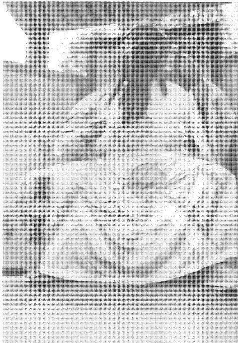
圖4 關羽讀《春秋》坐像(攝於北京北海公園中自貢燈會)。

關羽獵中要斬曹操，歷史上本來是為了爭一個女人(見前述)。現在不但把這一醜聞掩蓋過去，還反過來給關羽臉上貼上了一片「忠」的金葉。最奇妙的莫過於，居然把關羽投降曹操這件大不忠的事，也能說成是「忠」而加以歌頌。這就是所謂「三約明志」，說關羽投降前與曹操講條件：「吾與皇叔設誓，共扶漢室，吾今只降漢帝，不降曹操。」 ⑥ 由此可見，封建統治者為了美化關羽，真是使盡了「化腐朽為神奇」的手段來。