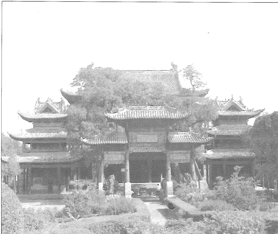
圖2 山西解州的關帝廟，被公認為是世界關帝廟的祖庭。

曹待之甚厚，拜為偏將軍。但當他得知劉備已奔袁紹營中，便一心去投袁紹。在袁曹鬥爭中，他為了表達對曹厚恩的感謝，竟親手斬殺了已是劉備盟友的袁紹大將顏良，然後再去投奔袁紹。這完全是不顧原則、以義害仁的行為。後人為了美化關羽，據此創造出所謂「身在曹營心在漢」的「曲線救國」的理論，危害極大。