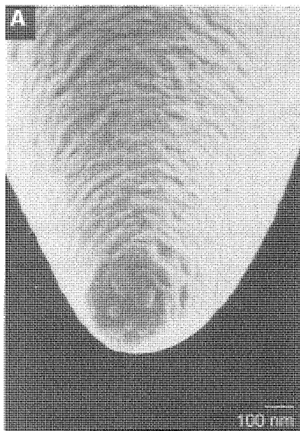
NSOM光纖探頭尖端：700Å直徑的出口被1000Å厚的鋁膜四圍包裹