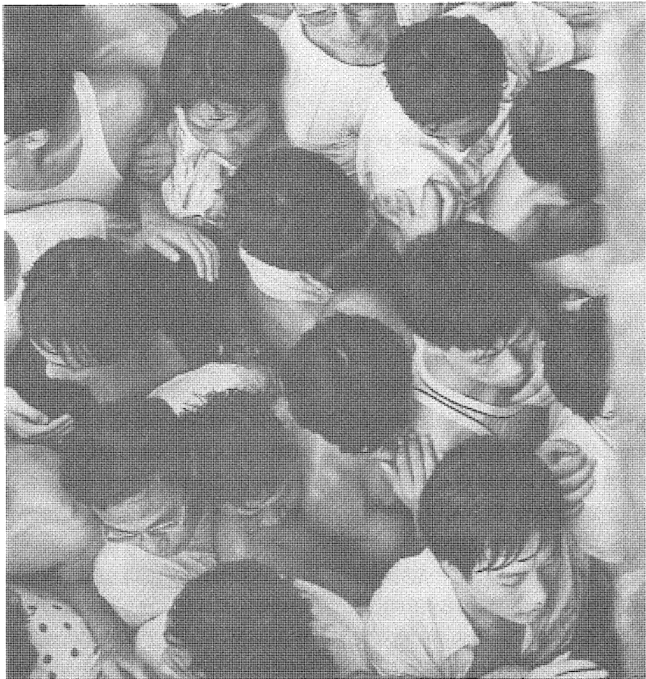
1992年深圳股票搶購狂潮，讓全國老百姓第一次認識到股份制的吸引力。

各地一大批當權者競相來搞「股份制改造」，撈一大把「原始股票」。至於企業是否能「改造」，當然都不是這批吃「阿公」（公有制）飯的官員和「企業家」所要考慮的。