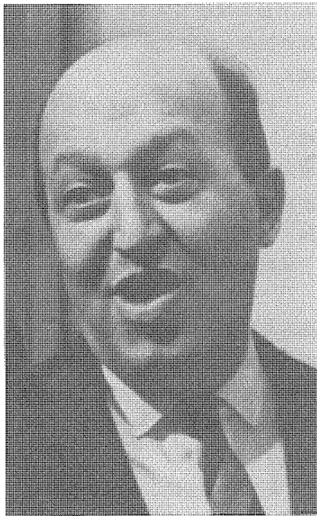
格林伯格藉其深具影響的藝評文章，把美國的先鋒藝術推向頂峰。

僅小有名聲的波洛克(Jackson Pollock)，當全球都在炸彈中震動時，他們試圖實踐一種新的美學原則。五年後，1947年，波洛克用他那大渾大灑、狂放不羈的滴瀝(drip)震動藝壇，開創了抽象表現畫派(Abstract Expressionism)，而格林伯格則儼然成為這一派的教主。二人攜手在戰後創造了美國先鋒藝術的黃金期。