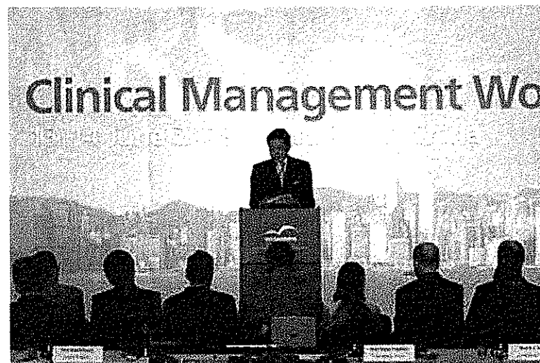
衛生福利及食物局與世界衛生組織聯合舉辦一個為期兩天的SARS工作坊，來自世界各地專家聚首一堂，衛生福利及食物局局長楊永強在嚴重急性呼吸系統綜合症臨床診治工作坊開幕禮上致辭。(2003年6月13日)