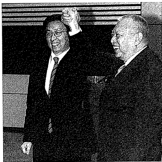
由上海市市長韓正率領代表團，與特區政府官員舉行首次「滬港經貿合作會議」，特區政府與上海市達成共識，同意在8大領域加強合作。(2003年10月27日)