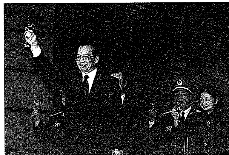
國務院總理溫家寶出席慶祝酒會，並舉杯祝福香港特別行政區的未來。(2003年7月1日)