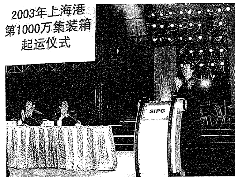
上海市委書記陳良宇宣佈第1000萬箱集裝箱正式起運，並啟動縱桿。2003年，上海港貨物和集裝箱吞吐量列世界第二、三位。(2003年11月30日)