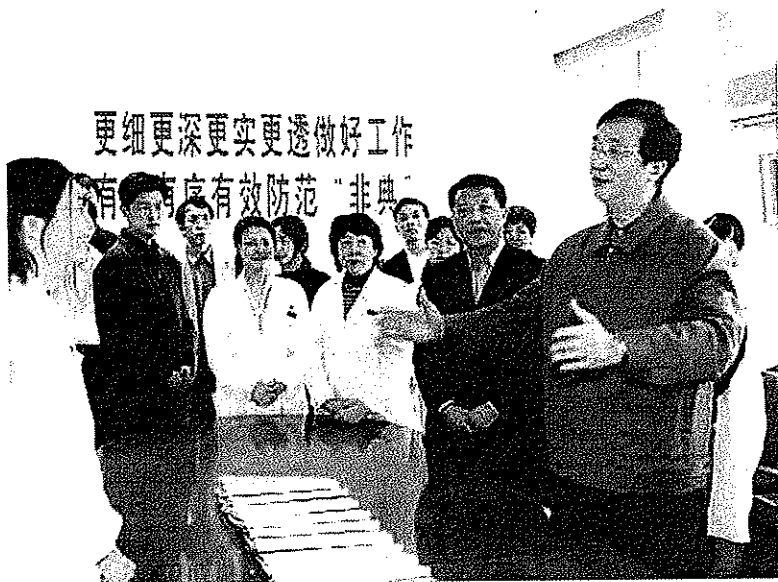
上海市委書記陳良宇，市長韓正，市委副書記羅世謙、殷一瑾等，深入基層檢查非典型肺炎防範工作。(2003年4月20日)