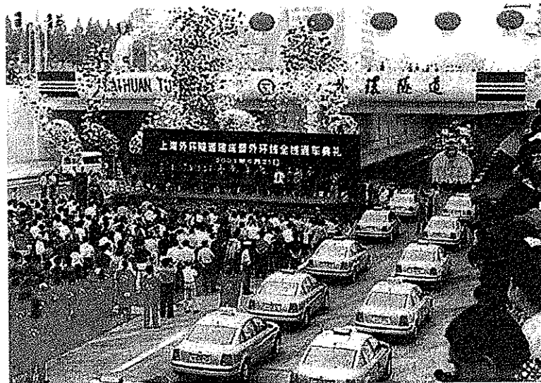
上海外環隧道工程建成通車，它是亞洲最大沉管隧道。江澤民親筆為隧道題名。(2003年6月21日)