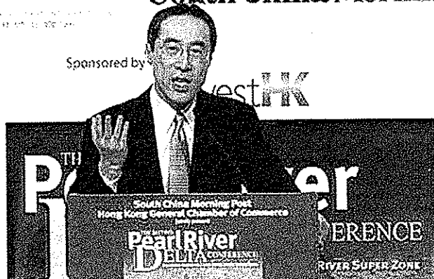
財政司司長唐英年在第二次珠江三角洲午餐會上發言（2003 年 10 月 17 日）