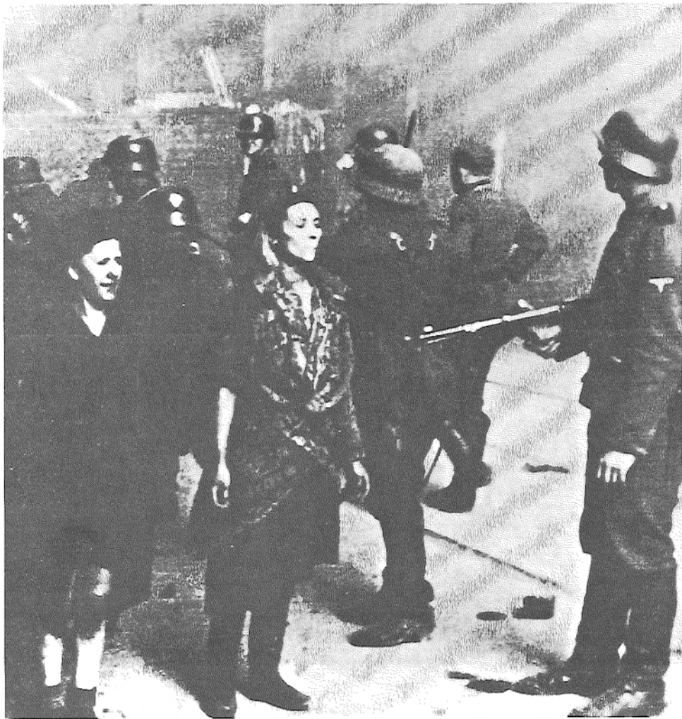
圖 從「大屠殺」中逃生的猶太人雖也感到負罪的重擔，但那和刺激文革餘生者的同謀感卻並不一樣。

從「大屠殺」中逃生的猶太人雖也感到負罪的重擔，但那和刺激文革餘生者的同謀感卻並不一樣。皮利磨·拉維道出了那種自卑感：「最壞的，最能適應的，活下來了；最好的卻都死去……我們這些能逃生的，作不了