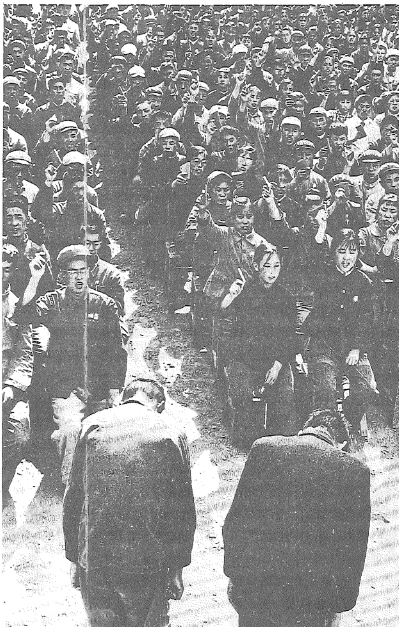
圖 中國和猶太民族都好古，而且了解人容易記得，也容易忘記。

自然的行爲。中國和猶太兩個民族都好古，而且了解人容易記得，也容易忘記。在這兩種文化之中，記憶並不是任由自然、命運或者人的興會來決定，而是由點點滴滴的往事培養出來：過往雖然已經消逝不可復見，但它仍然是當代人所依戀不捨的。