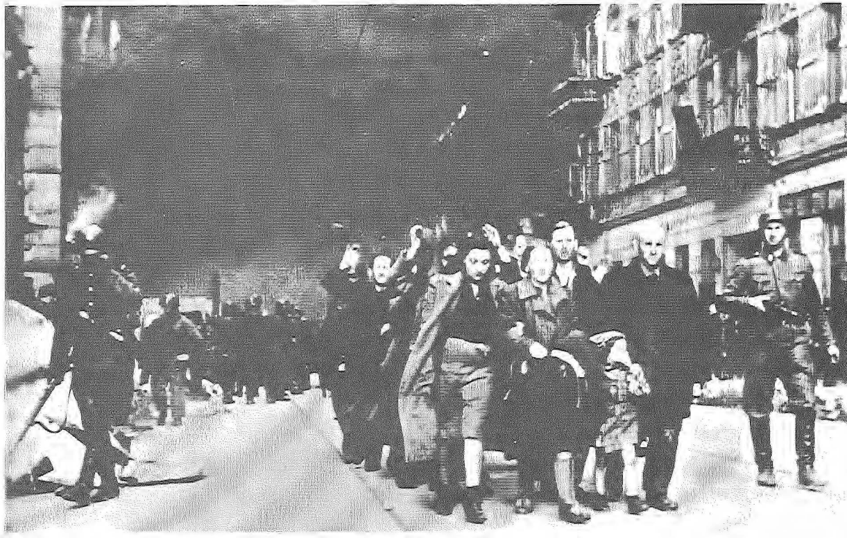
圖 經歷流亡和多次大難之後，猶太人的回憶得同時具有哀悼、慰藉和紀念的功能。

對唐朝詩人來說，時間的流逝是極其自然的事，這是和猶太傳統不一樣的。時光推移所帶來的損失，是世代嬗遞的必然結果。所以山川故舊能保留善忘的人往往忽略的勝迹。在觀