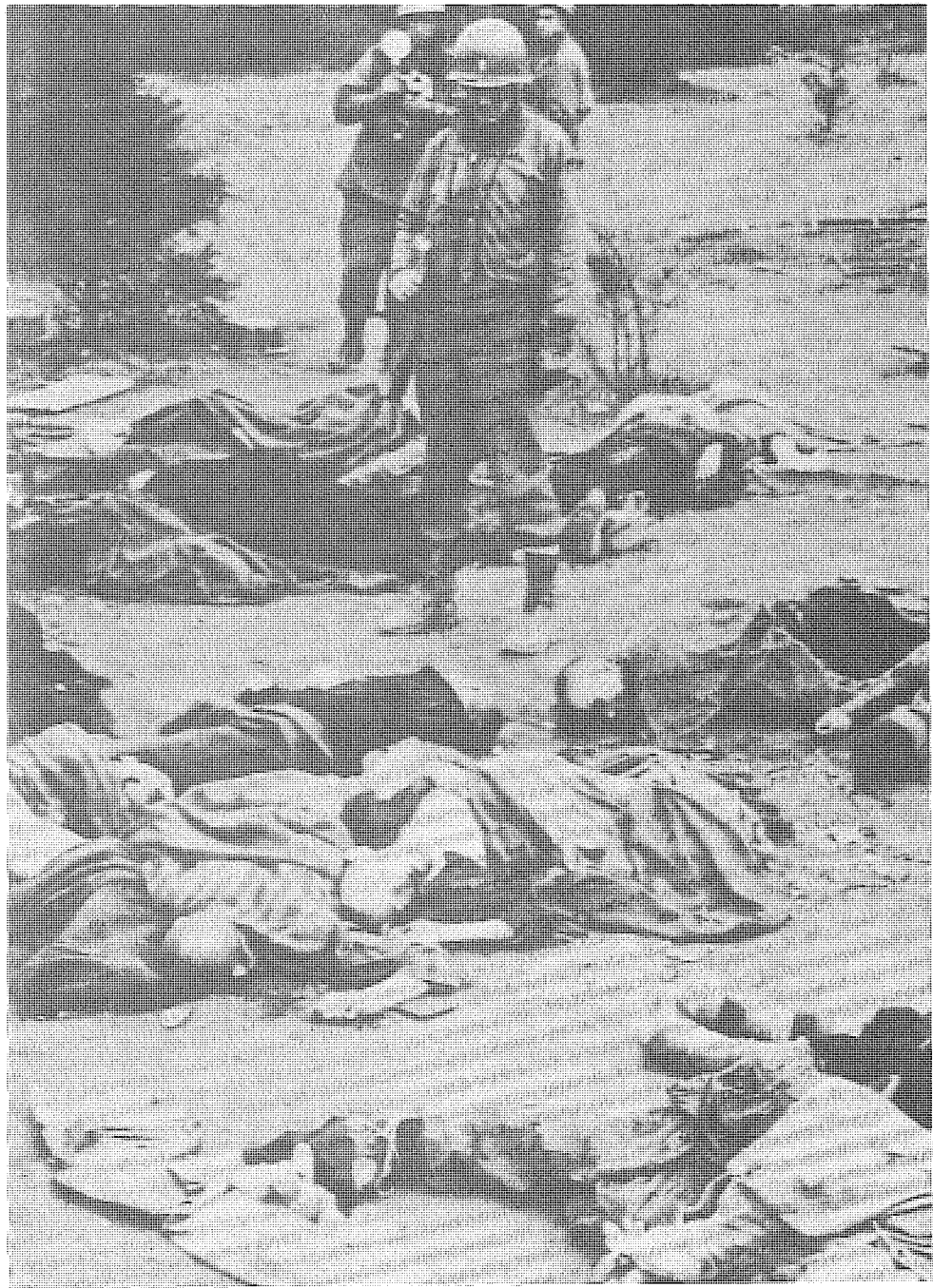
圖 在大屠殺期間，集中營裏的猶太人面對着史無前例和毫無理性的命運。

在毛澤東治下的受害者被打成「牛鬼蛇神」，被關進「牛棚」。這樣地把「人民公敵」有系統地「非人化」始於50年代，到60年代則發展成為大規模的集體迫害。