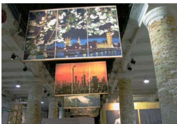
圖5：楊詒蒼 《Crying Landscape》（2003），多媒