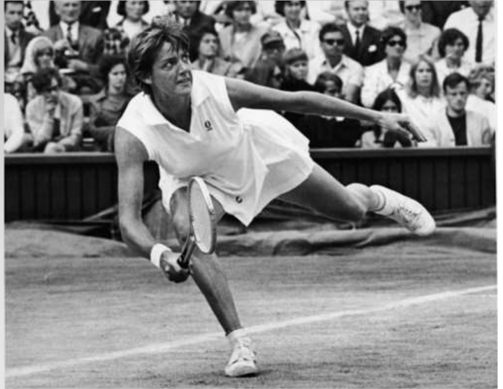
Margaret Smith Court