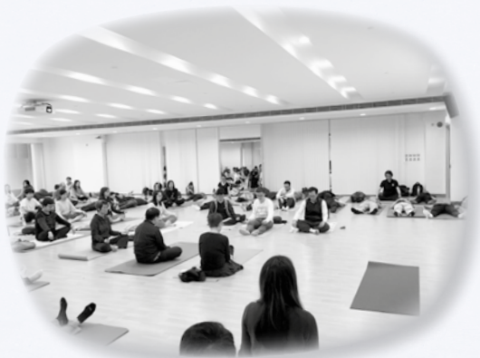
參加者以靜坐方式練習靜觀

透過伸展、靜坐、躺臥、步行、進食等方式體驗靜觀，老師學習減壓放鬆的方法和技巧，初次覺察自己五官的感覺，意識當下的情緒，也為自己能夠在完全靜默、安靜的狀態下進食午餐感到驚訝。活動結束之後，許多老師表示靜觀能幫助他們減壓，調節心情。