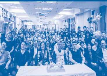
黃根春教授惜別會