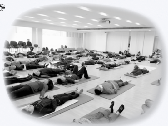
參加者以躺臥方式體驗靜觀