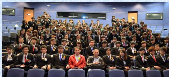
化學系聯系會交職大會