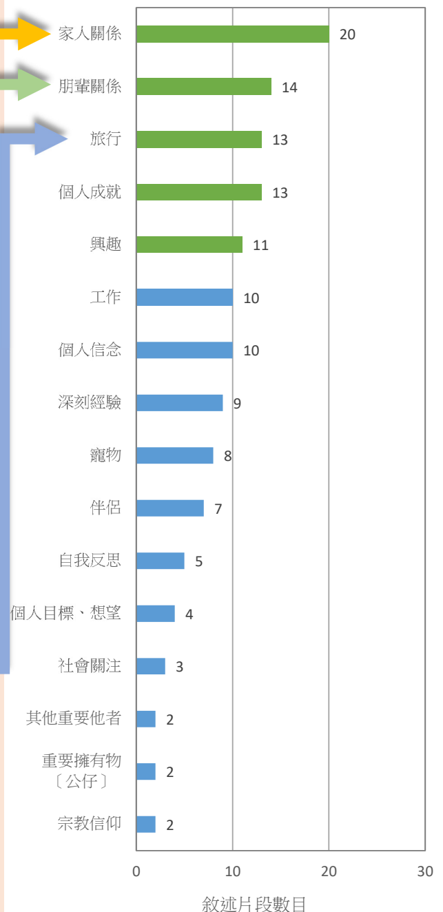
圖一 受訪青年人對於「帶給自己生命意義的事物」的照片敘述分佈

「遊歷」在我人生是好重要，因為我覺得世界這麼大，是應該要去不同的地方去 explore 一下；我覺得「遊歷」是在充實我的人生，讓我知道更加多這個世界其他的地方是怎樣。