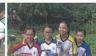
第二班// 12月除草、疏苗與施肥