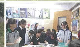
第四班// 在學校製作蘿蔔糕