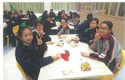
四班同學親手摺金魚，祝長者「年年有餘」▶

課外活動組為全級學生組織與長者有關的服務活動——「本土蘿蔔關愛情」。希望藉農曆新年的歡欣日子，將由學生親自下種的蘿蔔收割，由學生及家長烹製健康的蘿蔔糕，送給有需要的長者，與眾同樂。