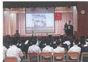
▲講座中學習 5Rs 概念

可持續發展(Sustainable Development)，或永續發展是指在保護環境的條件下既滿足當代人的需求，又以不損害後代人的需求為前瞻的發展模式。中二級以可持續發展和服務相結合，學生既學得塑膠方面的環保知識，又能夠建立服務精神，並美化身處的校園。