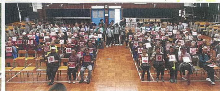
▲各班代表在聯歡會上表演，並送上由同學們親手準備的禮物：如意剪紙、利利是是金魚、健康蘿蔔糕