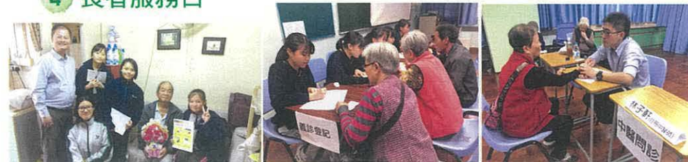
▲學生出外探訪區內長者