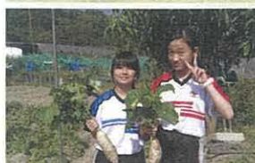
第三班// 農曆新年前收割蘿蔔