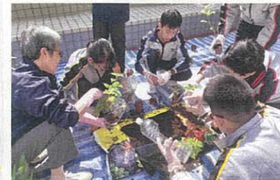
▲學生一人一花參與種植，將花卉移植到膠樽裡面，並學習垂直綠化的原理，這次服務學習活動更獲得了康文署的綠化校工程——大圍圍種植中學組優異獎