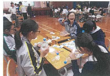
▲講座後將膠樽造成花盆，同時請來藝術家教授美化膠樽的技巧，美化後的膠樽作校園垂直綠化之用