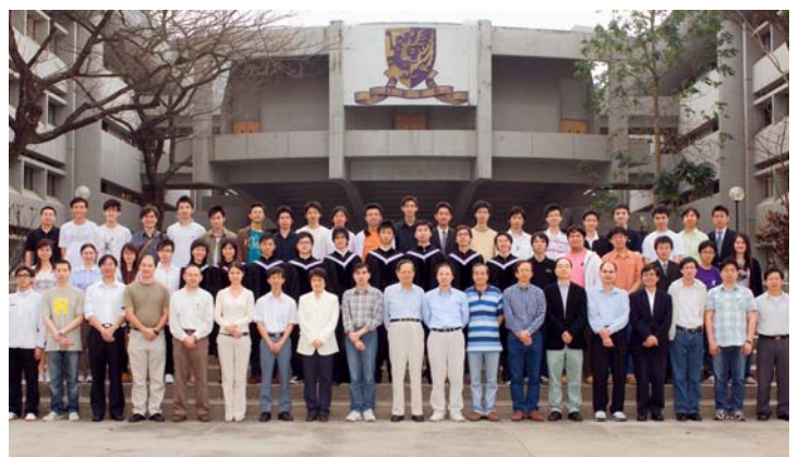
應屆畢業班同學與老師合照