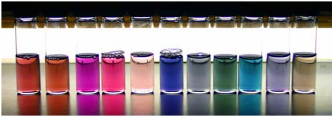
圖一：五顏六色的金納米顆粒溶液。

跟其他的貴重金屬一樣，金納米顆粒具有豐富的由表面等離子體共振（Surface Plasmon Resonance）引起的光學和電學性質。表面等離子體共振特性是金納米顆粒呈現出斑斕色彩的根本原因，當金納米顆粒表面等離子共振吸收波長落在可見光範圍的時候，波長微小的移動都會引起金納米顆粒顏色的明顯改變。