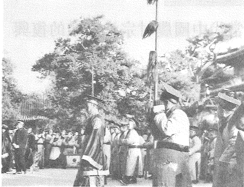
宗法組織的重新出現，再造了傳統社會家族對個人和資源的控制與分配。

的組織方式和人們定居類型的改變是至關重要的因素。但在這方面，1949年以後政府採取的政策甚至比前現代化時期的政策更具保守性和閉塞性。前現代化時期的中國，一個明顯的特點是對個人流動、遷徙及在市場進行買賣的權利不加限制。而1949年以後，中國政府則採取了嚴格限制人口流動、遷移和市場買賣的政策。這種硬性約束政策加強了各地區間的封閉性和凝固性，不但使由經濟發展狀況、婚姻傳統及居處習慣所決定的農村人口分佈特徵和1949年前一樣，還從根本上阻斷了通過市場網絡達到城鄉一體化的現代化道路。令人難以理解的是與此同時，中國政府卻提出和上述手段相反的目的：消滅城鄉差別。由於上述政策，政府在農村中推進的一系列旨在改造農村社會的運動，只是使農村社會產生了劇烈的震盪，並沒有將農村社會納入循序漸進