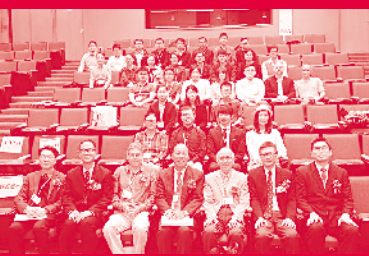
第九屆「基督教與中國社會文化」國際年青學者研討會