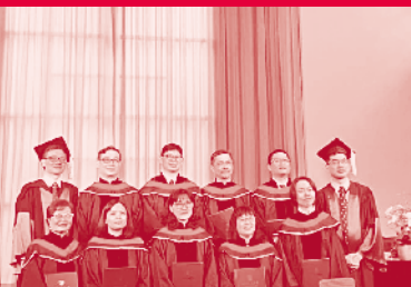
55周年校慶神學日感恩崇拜