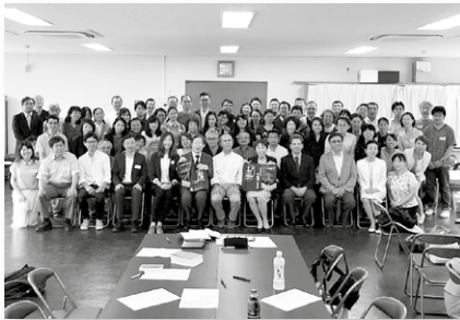
探訪東京神學大學