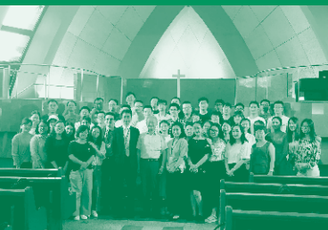
當代基督宗教教育資源中心