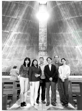
同學分五組探訪不同教會，此處為天主教東京座堂關口教會。