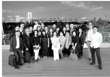
師生合照於東京台場