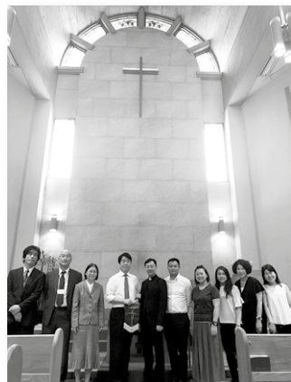
同學分五組探訪不同教會，日本基督教團阿佐教會