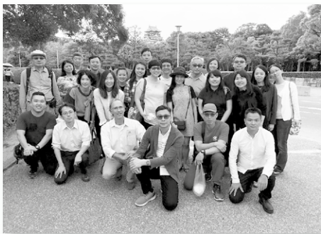
本院師生大阪城前留影