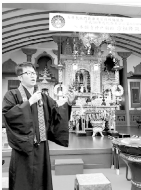
本願寺神戶別院住持