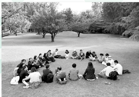
同學於探訪後分享