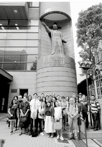
探訪青山學院大學