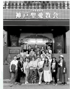
探訪神戶聖愛教會