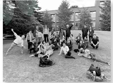
國際基督教大學前留影