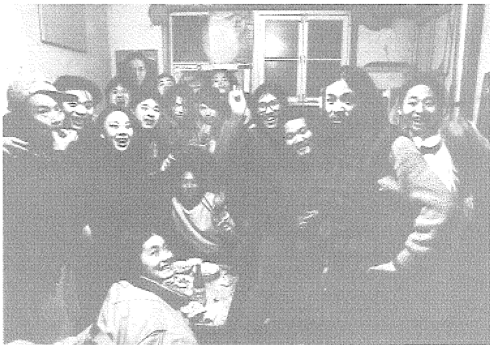
「流浪」到底是圓明園藝術家自覺選擇的生存方式，抑或只是他們無奈的宿命？

的影響已擺脫了地下狀態，但始終無法被納入當代的藝術體制中。他們仍處在邊緣的放逐狀態，甚至可能永遠被排除在體制之外而得不到明確的生存關係。他們是「地下的黑戶」。