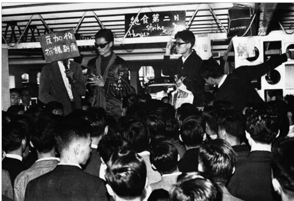
1966年4月，天星小輪加價引發的九龍騷動。（資料圖片）

不過，雖然左派的挫敗令殖民政府有了喘息的空間，但卻沒有使右派得益，事實上右派也因為暴動的出現而顯得手足無措。在冷戰年代覺醒較早而