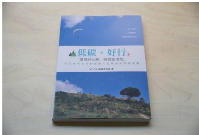
《低碳·好行》收錄39個城市及郊野旅行路線。(吳國權攝)

Source from: HK01 - https://www.hk01.com/article/14820