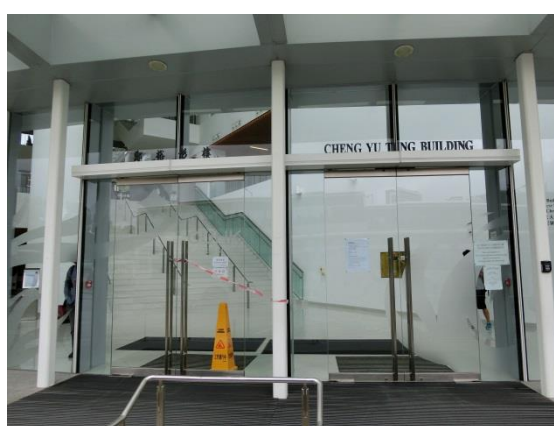
③ 会場となる鄭裕彤樓(Cheng Yu Tung Building)とその入口の外観 ※会場となる建物の隣に「香港凱悅酒店(沙田)」 (ハイアットリージェンシー香港シャーティン(沙田))があります。