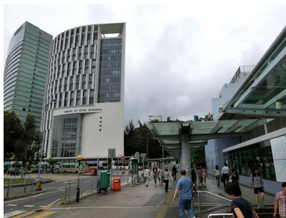
② B出口から 大学駅を背にして右方向 にバス停に沿って歩いてください。前方に会場の建物が見えます。徒歩1分くらいです。