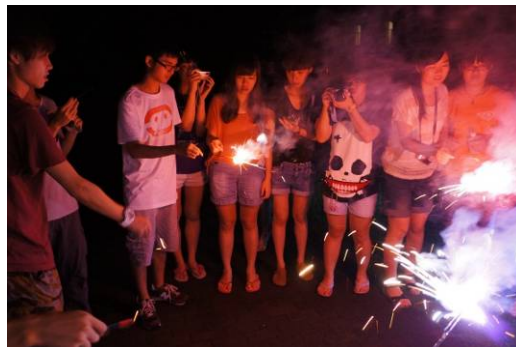
夜裡在河邊玩煙火