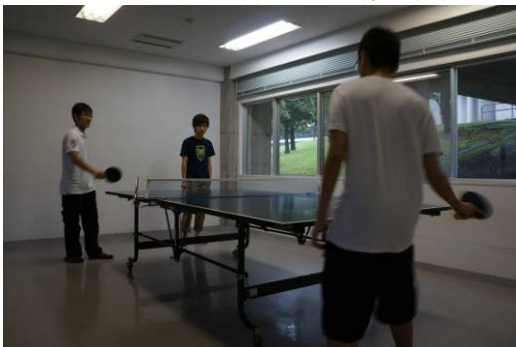
在娛樂室打乒乓球

每天下午 4 時左右便是自由時間，KAPIC CENTER 的娛樂室是消磨時間的好去處，最初幾天，我和其他團員都到那打桌球、乒乓球。KAPIC CENTER 的職員都十分親切，盡量迎合我們的要求：團員的寄宿家庭送了她一包煙火，KAPIC CENTER 的職員安排我們到附近河邊的空地玩煙火；大家想踩單車，CENTER 借出十多部單車給我們；碰巧團員生日，職員準備了蛋糕，作了一個理由集合大家為她慶祝生日。在研修課程期間，我們每一天都要提交日記，KAPIC CENTER 的職員都很用心的幫我們批改，並附上感想。