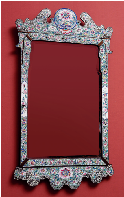
图四 铜胎画珐琅缠枝花卉开光镜框