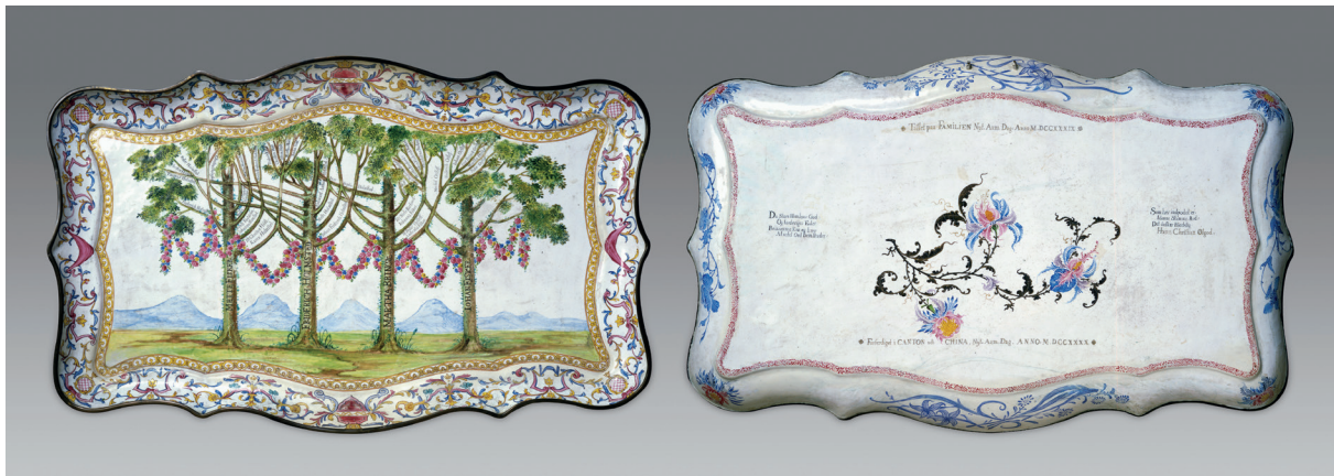
图三 铜胎画珐琅族谱长方盘

Castle)。[1] 灯架呈椭圆形，外围装饰白地缠枝花卉立鸟花纹，正中绘制中式人物、山水图景（图二）[2]。根据订单资料，本组壁灯架为 Lintrup 在 1738 或 1741 年订购于广州 [3]。