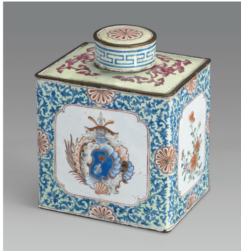
图七 铜胎画珐琅卷草纹章茶叶罐