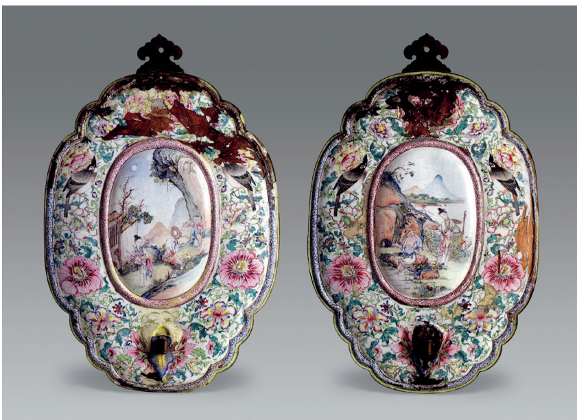
图二 铜胎画珐琅缠枝花卉纹开光山水人物壁灯架