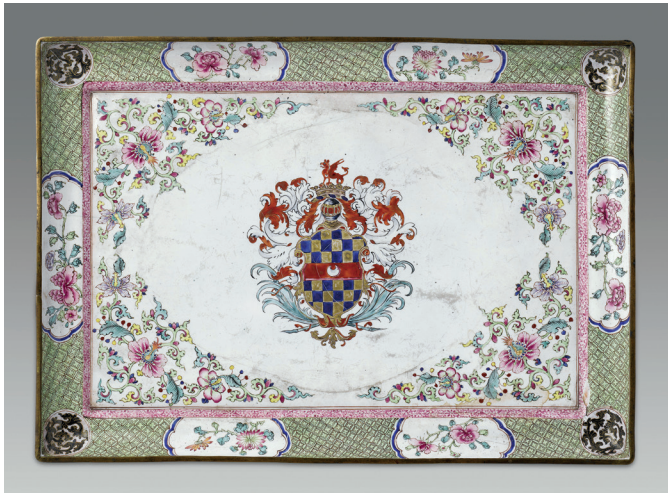
图六 铜胎画珐琅锦地缠枝花卉纹章长方盘