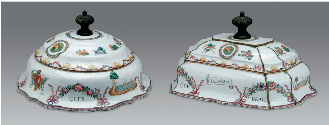
图八 铜胎画珐琅西洋图案花环带纹章纹章盖盘