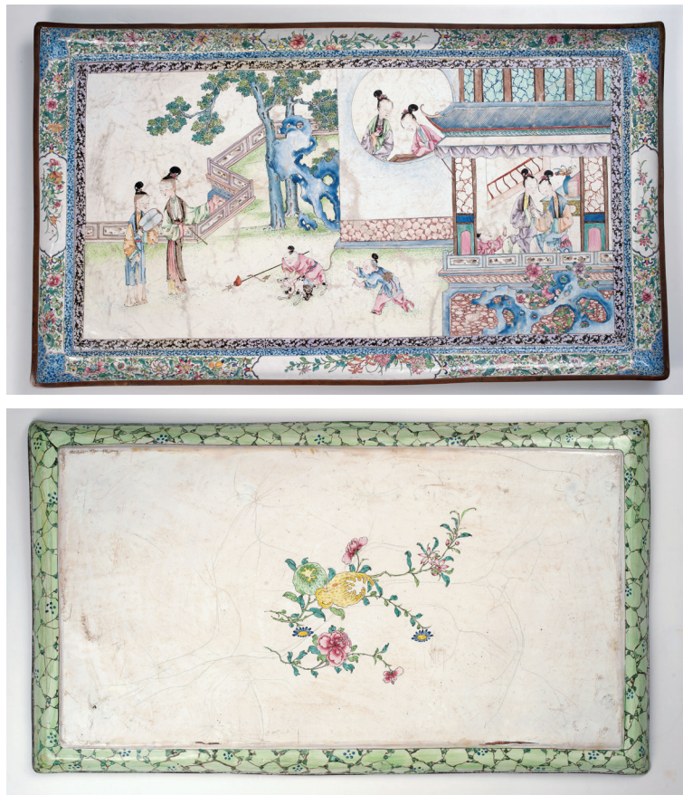
图九 清乾隆铜胎画珐琅仕女婴戏图长方盘

丰富而浅淡的色彩，使得广东珐琅在表现绚丽效果的同时，也试图追求雅致的趣味。在对绚丽效果的表达上，广东珐琅得到了时人的认同，乾隆时人唐秉钧在《文房肆考图说》中即称广东珐琅（洋瓷）“绚彩华丽” [1] 。同时，唐氏似乎并不认可广东珐琅在雅致趣味上的追求，认为其“仅可供闺阁之用，非士大夫文房清玩也” [2] 。表面上看，这似乎表明了士大夫的负面态度。但实际上，唐氏的评价基本抄袭自《格古要论》对大食窑的点评 [3] ，表明其是品鉴传统而非时人看法。因此，清代士大夫阶层对广东珐琅的看法，还有待更多材料的解读。