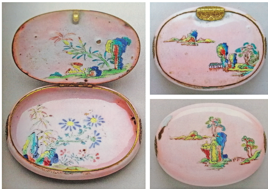
图十 清康熙铜胎画珐琅山水图小盒

综上所述，18世纪中叶的广东珐琅有着较好的质量和审美意趣，从而引起乾隆帝的注意并安排粤海关雇佣广东工匠，为宫廷制作珐琅。乾隆