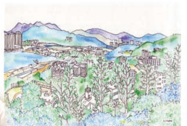
Her first drawing in Hong Kong, view from a guest room at New Asia College