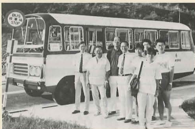
八九年九月院長(左四)及輔導主任(左一)與交通組職員及學生乘搭第一班穿梭逸夫書院的校巴，眾人攝於逸夫書院候車處。