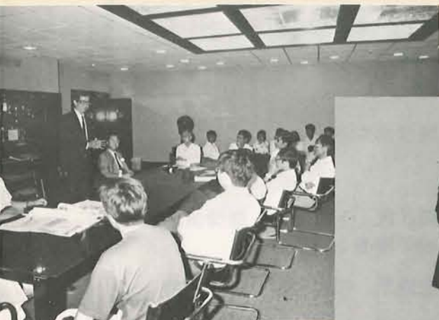
教授與研究生舉行研討會。