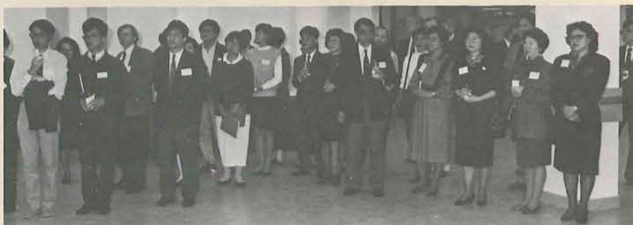
出席院慶茶會的嘉賓