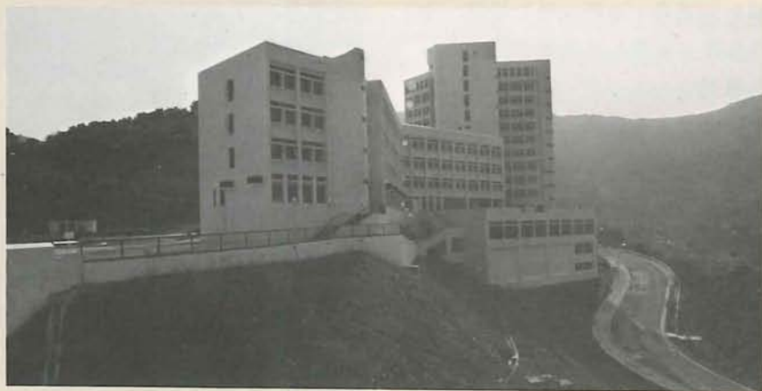
逸夫書院學生宿舍、教育行政樓及教職員宿舍八九年十月正式啓用。