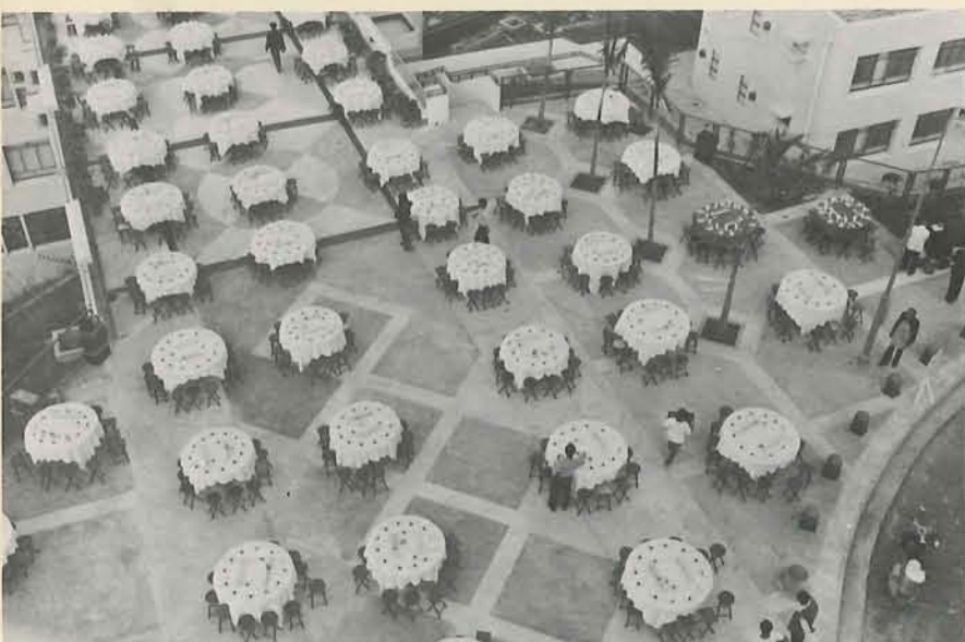
院慶夜文瀾堂外的師生聚餐