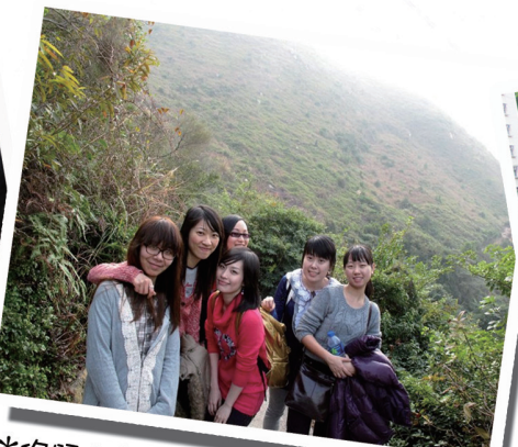
*你跟同學是否「hi-bye friend」? 一起行山亦是增進感情的好方法!