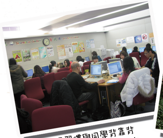
米我們總是習慣與同學背靠背 名自工作,但其實「背靠背」亦 是難得的緣份。